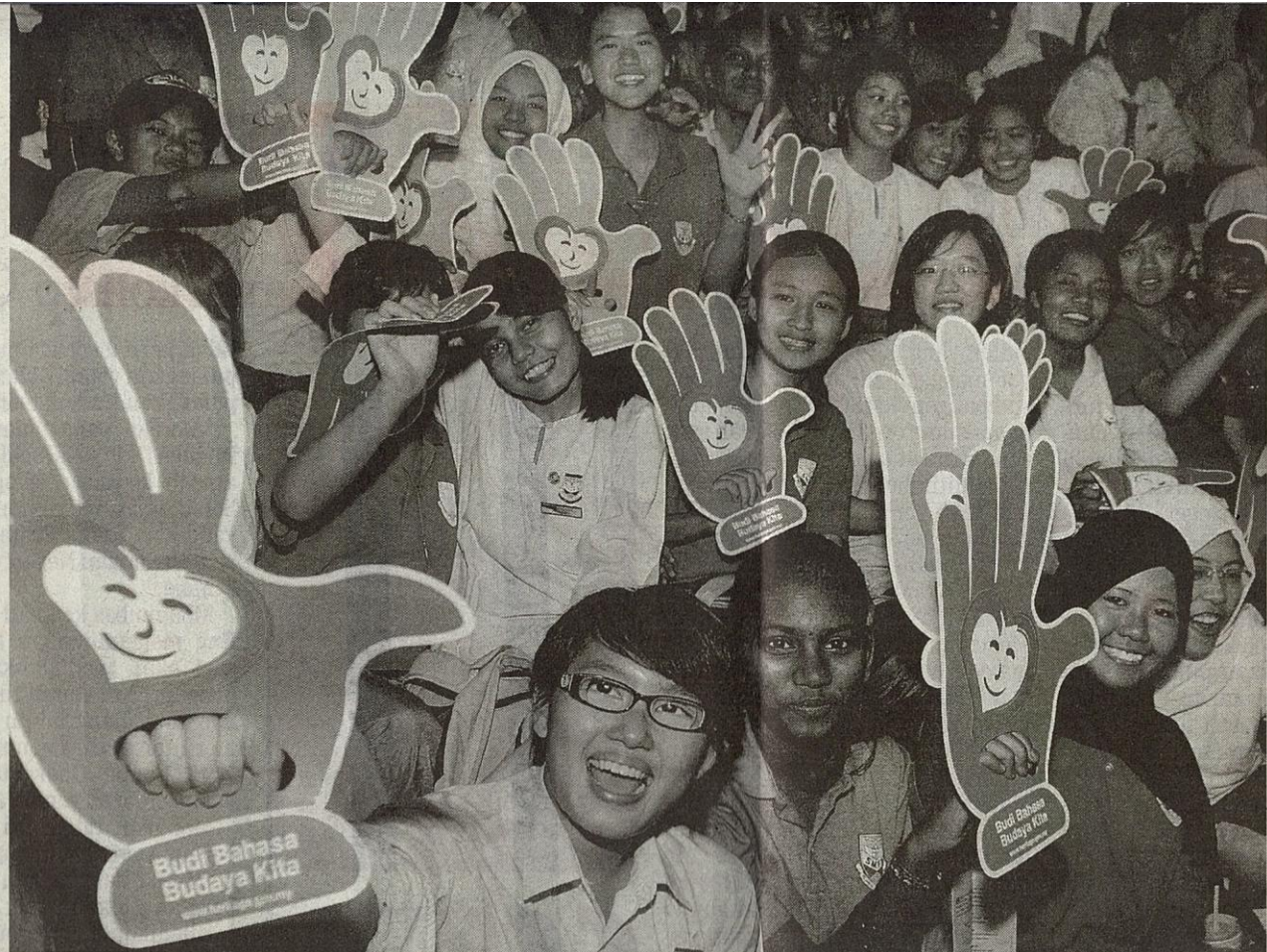
KEMPEN Budi Bahasa dan Nilai Murni bertujuan mewujudkan masyarakat bersifat mulia, beradab, bersopan, bertoleransi, saling me-

Rukun Negara mempunyai lima objektif, iaitu untuk mencapai perpaduan yang lebih erat dalam kalangan seluruh masyarakat ma-