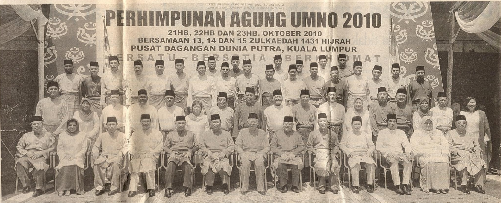
DATUK Seri Najib Razak bergambar kenangan dengan Ahli Majlis Tertinggi UMNO selepas perasmian Perhimpunan Agung UMNO Ke-61 di PWTC, semalam.

BERSATU ~ BERTAMBAH ~ BERKUALITI ~ BERKHIDMAT