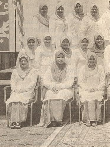
DATUK Seri Najib Razak bergambar kenangan dengan Ahli Exco Wanita UMNO sebelum perasmian Perhimpunan Agung UMNO Ke-61 di PWTC, semalam.