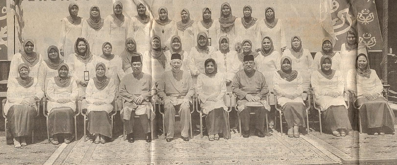
DATUK Seri Najib Razak bergambar kenangan dengan Ahli Exco Wanita UMNO sebelum perasmian Perhimpunan Agung UMNO Ke-61 di PWTC, semalam.

Saudara dan saudari, Menyongsong kisah pencapaian itu, kita ingin bertanya, apakah jenis bangsa yang berjaya menunjangi perjuangan hebat ini? Apakah sistem nilai yang dipegang? Persoalannya di sini, bukanlah kita ingin terganggu dengan kejayaan lalu, na-