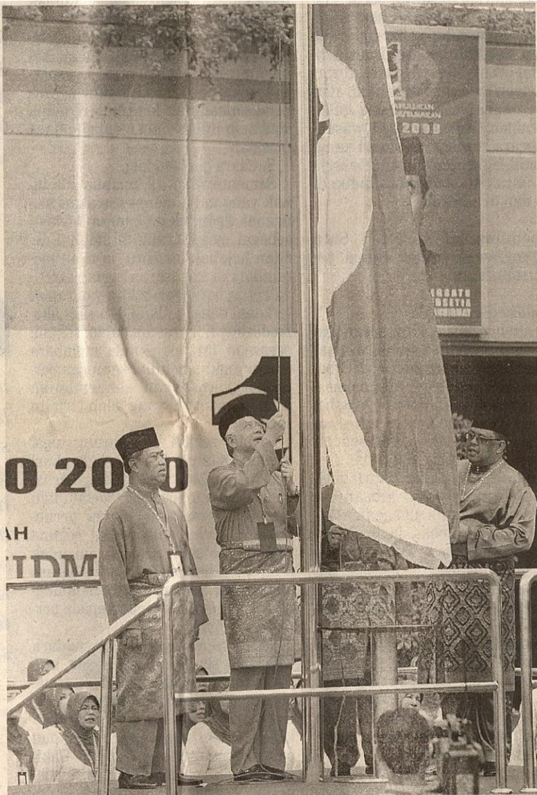
DATUK Seri Najib Razak menaikkan bendera UMNO dan disaksikan oleh Timbalannya, Tan Sri Muhyiddin Yassin sambil menyanyikan lagu Negaraku dan lagu UMNO sempena Perhimpunan Agung UMNO Ke-61, semalam.

Seterusnya lagi, jika ikrar setia yang telah diwaad, dilanggar sewenang-wenangnya apabila tidak sesuai dengan selera atau kepentingan tertentu, akan hancurlah ke-