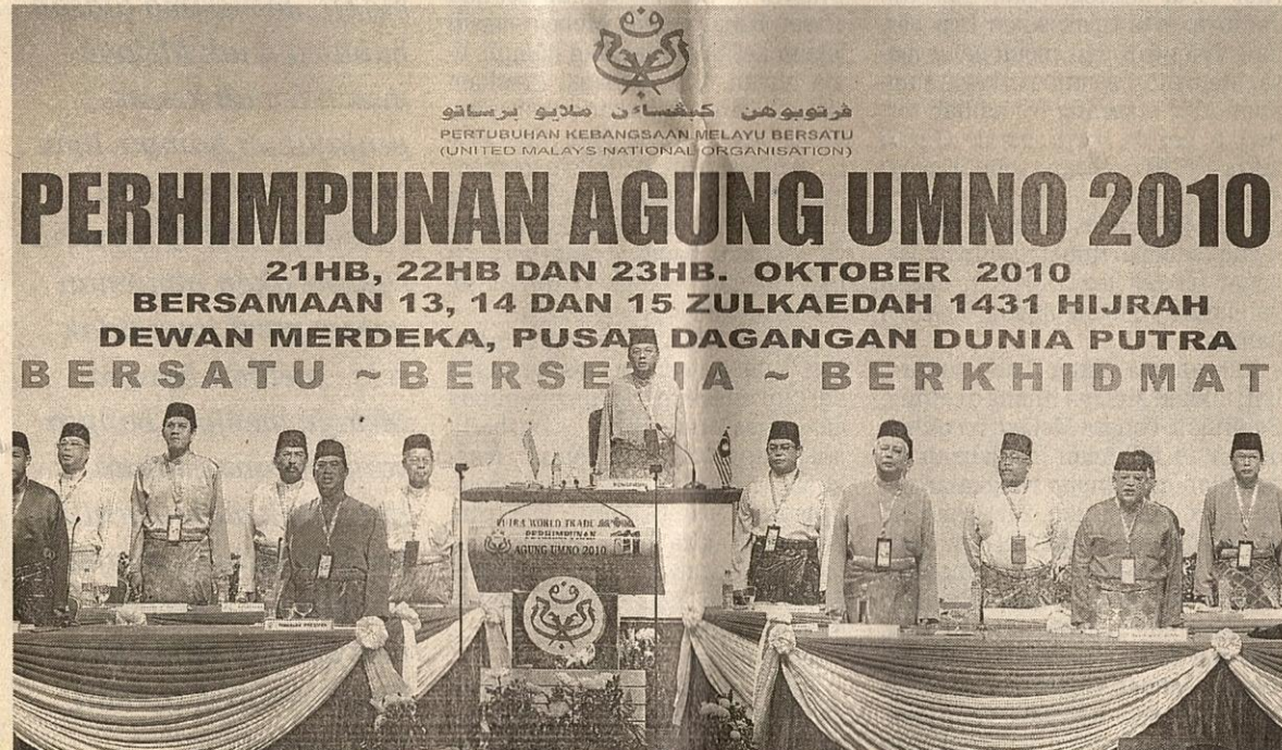
DATUK Seri Najib Razak dan Tan Sri Muhyidin Yassin bersama Ahli Majlis Tertinggi menyanyi lagu Negaraku pada Perhimpunan Agung UMNO 2010 di Pusat Dagangan Dunia Putra, semalam.

menegang rampan kuasa? Bolehkah rakyat Malaysia meletakkan kepercayaan terhadap mereka ini yang saban waktu dan saban masa hanya mengidam menduduki pusat pemerintahan? Sanggupkah kita menyerahkan Malaysia tercinta ini kepada pengkhianat bangsa dan tanah air? Sesungguhnya, kepada saudara dan saudarilah nasib parti kita dipertaruhkan. Dalam genggaman saudara dan saudarilah pembelaan UMNO kita dambakan. Di bahu saudara dan saudari sekalianlah, tergalas, warisan Parti Kebangsaan Melayu Bersatu ini”