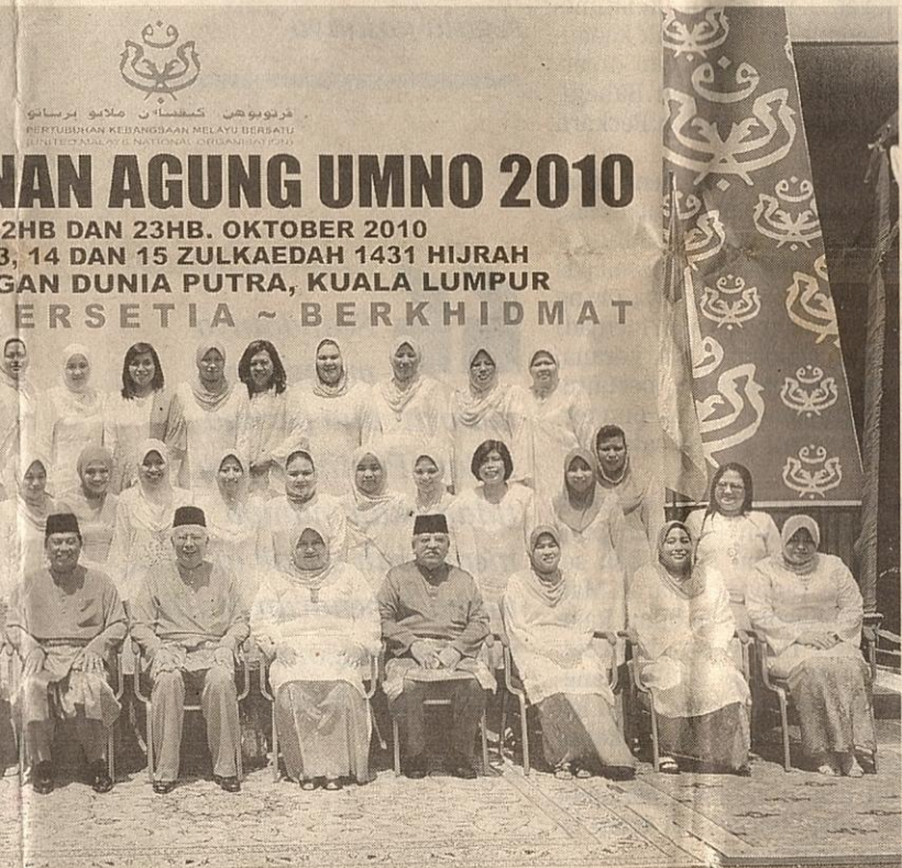
Anggota dengan Ahli Exco Puteri UMNO sebelum perasmian Perhimpunan Agung

Lebih indah pula, ciri kepemimpinan Melayu yang saya utarakan ini, telah dimurnikan dengan tibanya ajaran Islam yang menyeru,