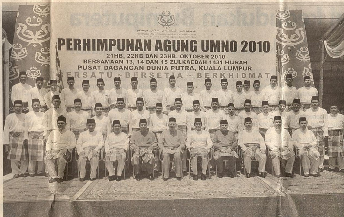
DATUK Seri Najib Razak bergambar kenangan dengan Ahli Exco Pemuda UMNO sebelum perasmian Perhimpunan Agung UMNO Ke-61 di PWTC, semalam.

Tidak lengkap lagi senarai ini sebenarnya: Jakun dan Sakai asli Melayu, Arab dan Pakistani, semua Melayu Mamak dan Malbari serap ke Melayu. Malah muallaf bertakrif Melayu. Mendakap realiti semasa Malaysia pula: Kadazan, Bajau, India Muslim dan Siam, Melanau, Bidayuh dan berpuluh suku kaum. Kita bersama dalam serumpun., Di sudut perpaduan dan agama dinyatakan bahawa: Watak Melayu menolak permusuhan. Setia dan sabar tiada sempadan. Maruah dan agama dihina jangan. Hebat amuknya tak kenal lawan.