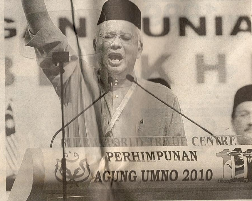
DATUK Seri Najib Razak merasmikan Perhimpunan Agung UMNO Ke-61 di PWTC, semalam.

Kerana itulah, tidak ada seorang pun dapat menafi, apatah lagi menidakan betapa besarnya pengaruh dan peranan parti keramat ini yang sejak turun-temurun kepemimpinannya