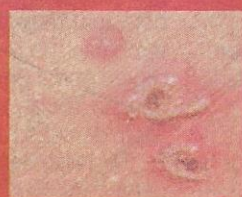
Campak merebak jika tidak diberi imunisasi pada peringkat awal.