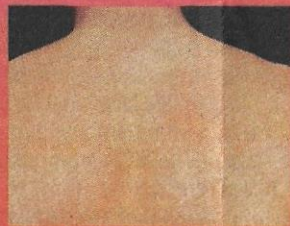
Campak Jerman boleh menyerang seluruh badan.

Rujukan disesuaikan dari http://abimuslih.wordpress.com ; http://gemini26576.tripod.com ; http://www.tanyadokteranda.com