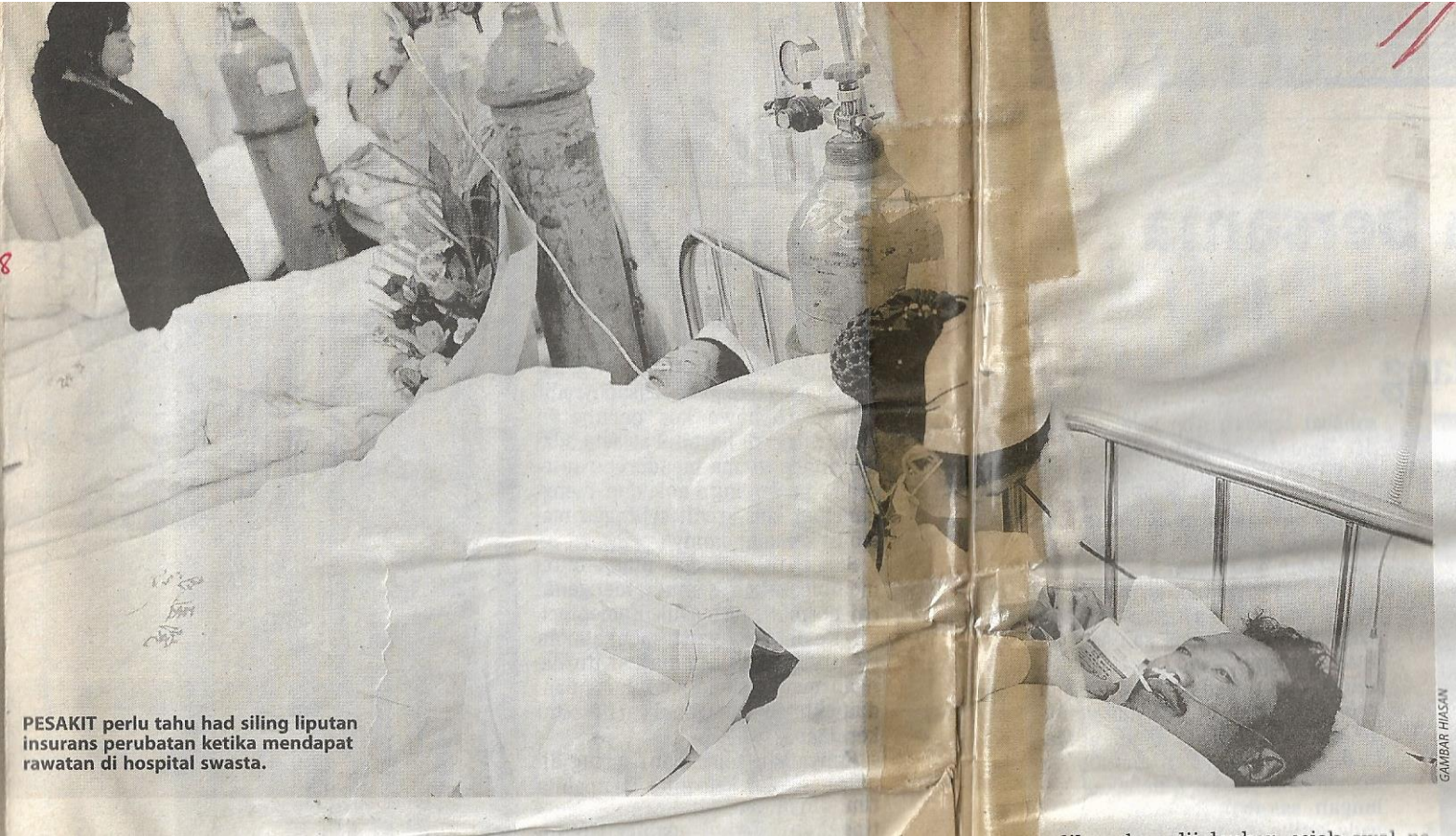
PESAKIT perlu tahu had siling liputan insurans perubatan ketika mendapat rawatan di hospital swasta.