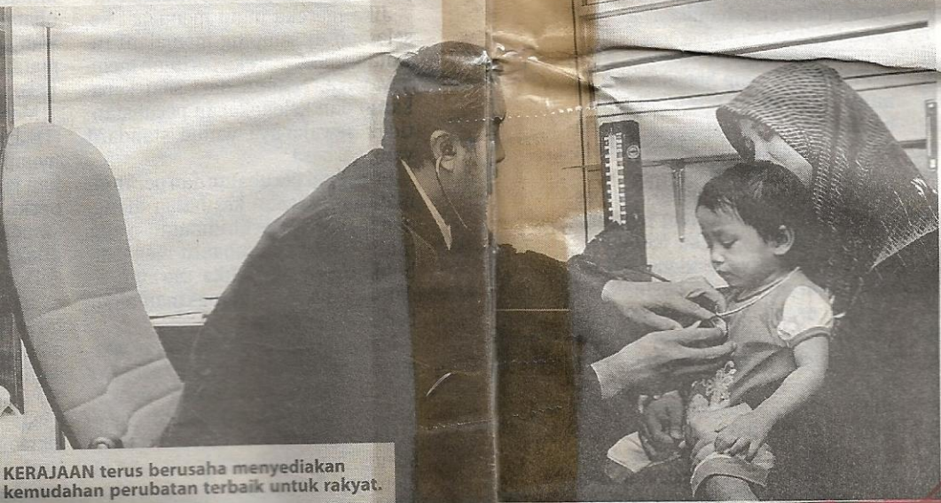
KERAJAAN terus berusaha menyediakan kemudahan perubatan terbaik untuk rakyat.

Selain inisiatif yang diambil pihak kerajaan dalam mengawal caj hospital swasta, setiap pesakit juga mesti mengetahui hak mereka. Pesakit digalakkan berbincang secara terperinci dengan doktor mengenai jangkakan kos dan prosedur yang akan dijalankan termasuk kos rawatan di unit jagaan intensif (ICU) atau unit jagaan koronari (CCU) jika berlaku komplikasi. Pastikan pesakit, jika pencairan premium, tahu mengenai kelayakan insurans yang ditandatangani seperti had siling liputan insurans serta kriteria insurans. Selain itu, pesakit perlu tahu tahap kemampuan membayar dan perlu bertanya caj dianggarkan bagi perkhidmatan jagaan kesihatan yang akan diberikan.