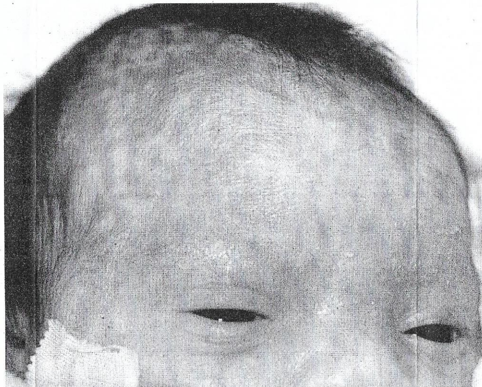
DISKOID LUPUS ERITEMATOSUS... gangguan kulit yang kronik.

● Demam, keletihan dan penurunan berat badan. Demam yang dialami biasanya berpanjangan sehingga beberapa minggu