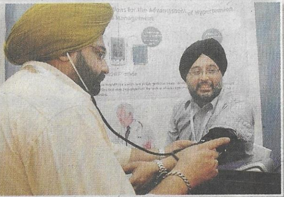
Lakukan pemeriksaan tekanan darah secara berkala.

"Orang Melayu terlalu banyak kepercayaan begini. Kalau hendak ambil ubat-ubatan alternatif boleh tetapi pada masa sama lakukan pemeriksaan tekanan darah dengan kerap dan kawal tekanan darah anda," katanya.