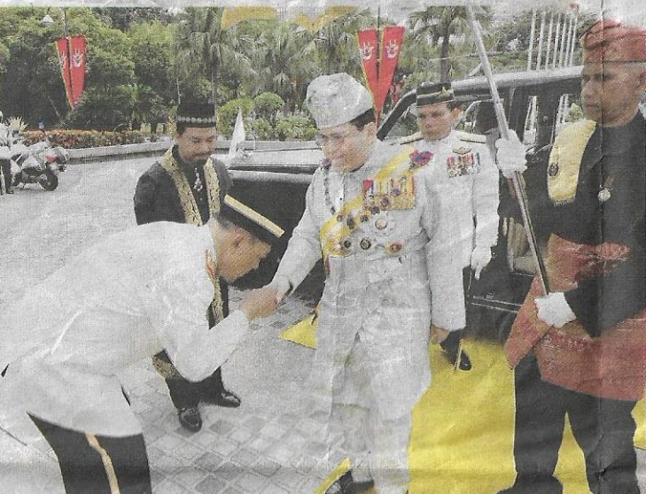
SULTAN Kelantan, Sultan Ismail Petra mempunyai darah keturunan Raja Jembal.