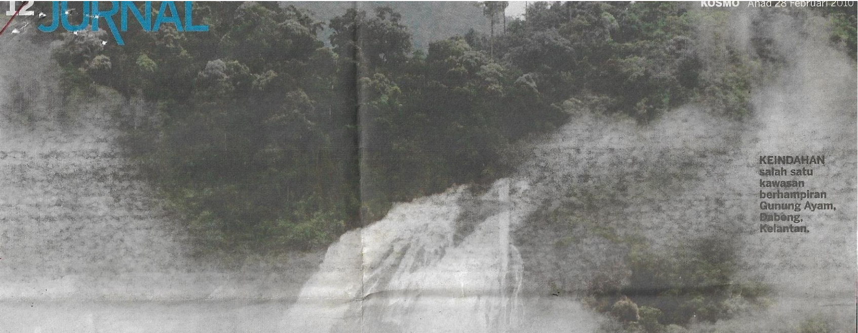
KEINDAHAN salah satu kawasan berhampiran Gunung Ayam, Dabong, Kelantan.