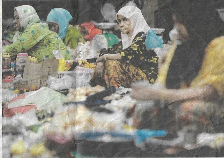
JIWA kepimpinan wanita Kelantan kelihatan terserlah dalam menerajui bidang perniagaan.

yang dikurniakan keramat. “Ada yang menceritakan, Cik Siti Wan Kembang memeluk Islam apabila ajaran Islam dibawa oleh pedagang-pedagang Arab. Sebab itulah namanya Wan Kembang, bukan Wan Fatimah atau Wan Aminah. “Biasanya individu yang menerima Islam dengan sepenuh hati, tambahan pula dia merupakan seorang pemimpin, membawa hikmah yang besar.