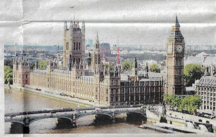
● Tidak berubah, di tempat sama di tebing Sungai Thames semenjak kurun ke-11 lagi!