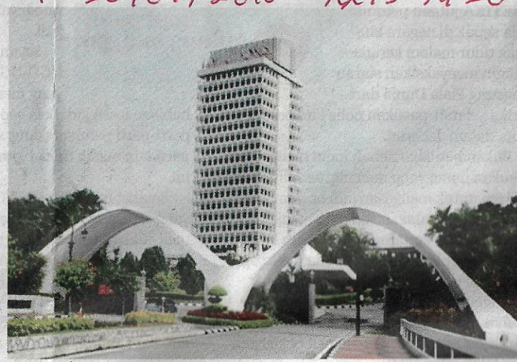
● Baru 48 tahun mahu diganti, tak ambil kira sejarahnya?

Bangunan Parlimen sekarang tiada banyak cacatnya. Benar ia perlu diperbesarkan, dilengkapi dengan alat-alat yang canggih sesuai dengan tuntutan masa. Bangunan itu harus dipindahkan lagi dan apa salahnya belanja RM200-300 juta baginya kalau berbuat demikian kita memelihara sejarah dan warisan dan memenuhi keperluan selama 100 tahun akan datang? Sime Darby rugi RM1.6 billion kerajaan tidakpun sibuk sangat. Mahu belanja RM200 - RM300 juta untuk warisan begitu ruih rendah! Parlimen British atau The Palace of Westminster berusia lebih 900 tahun, diperbaiki apabila perlu dan keanggotaan mereka lebih seribu orang termasuk Ahli Dewan Ketuanan (House of Lords). Bangunan Capital di Washington DC berumur lebih 200 tahun terletak di tempat sama!