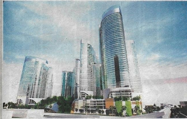
LAKARAN artis mengenai projek pembangunan Pusat Bandar Bukit Bintang ihsan Kumpulan Senireka Sdn. Bhd.

Timbalan Menteri Kewangan, Datuk Dr. Awang Adek Hussin dalam pembentangnya di Parlimen baru-baru ini memberitahu kawasan itu akan dibangunkan dengan projek pembangunan bercampur yang menempatkan pusat transit, servis apartmen, pejabat, pusat rekreasi, hotel dan premis perniagaan.