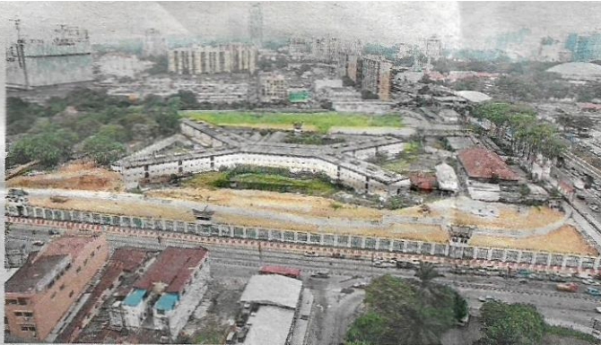
GAMBAR pemandangan dari atas sebelum kerja-kerja merobohkan tembok penjara dilakukan.

Tokoh sejarawan negara, Profesor Emeritus Tan Sri Dr. Khoo Kay Kim melihat