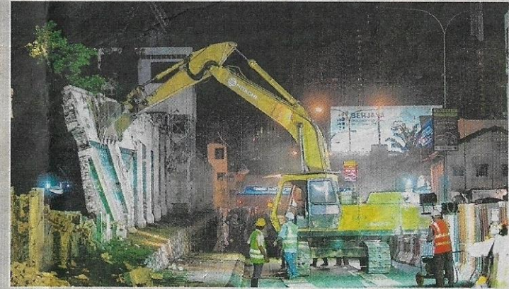
KERJA-kerja merobohkan tembok Penjara Pudu menggunakan dua buah jentolak bermula Isnin lalu.