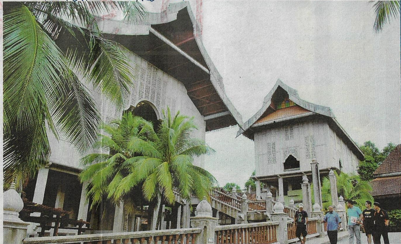
UNIK...seni bina muzium Terengganu diinspirasi dari istana lama Terengganu.

Turut dipamerkan, keris berpintal milik Sultan, pingat