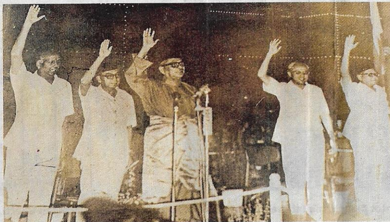
PENGUMUMAN tarikh Hari Merdeka oleh Tunku Abdul Rahman amat dinanti-nantikan oleh seluruh rakyat Tanah Melayu.

Namun, sepanjang berada di China, rasuah dan pemerintahan berat sebelah akhirnya membuka mata beliau untuk berbakti ke-