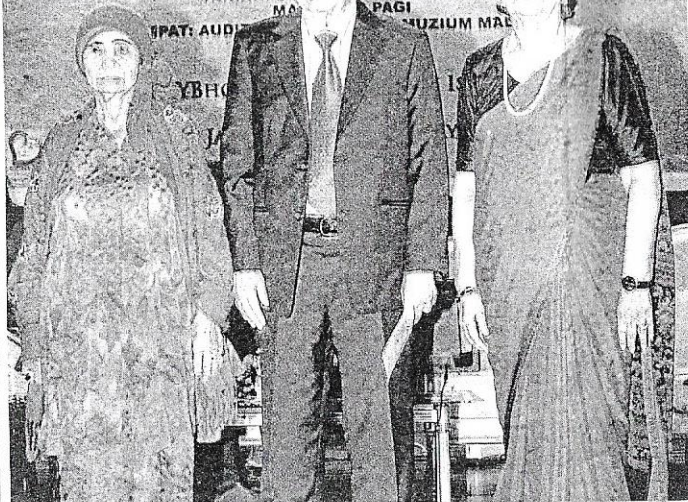
WIRA tiga bangsa ini banyak menyumbang kepada pembentukan Malaysia yang aman dan makmur seperti yang dinikmati hari ini.