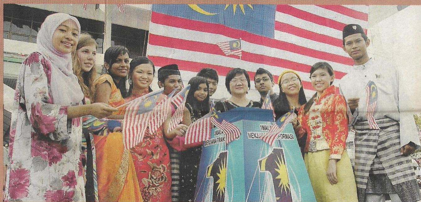
PENERAPAN asas jati diri di kalangan generasi muda perlu berterusan agar nilai murni tak terhakis.

Kesukaran generasi muda memahami maksud 1Malaysia adalah kesan meminggir-