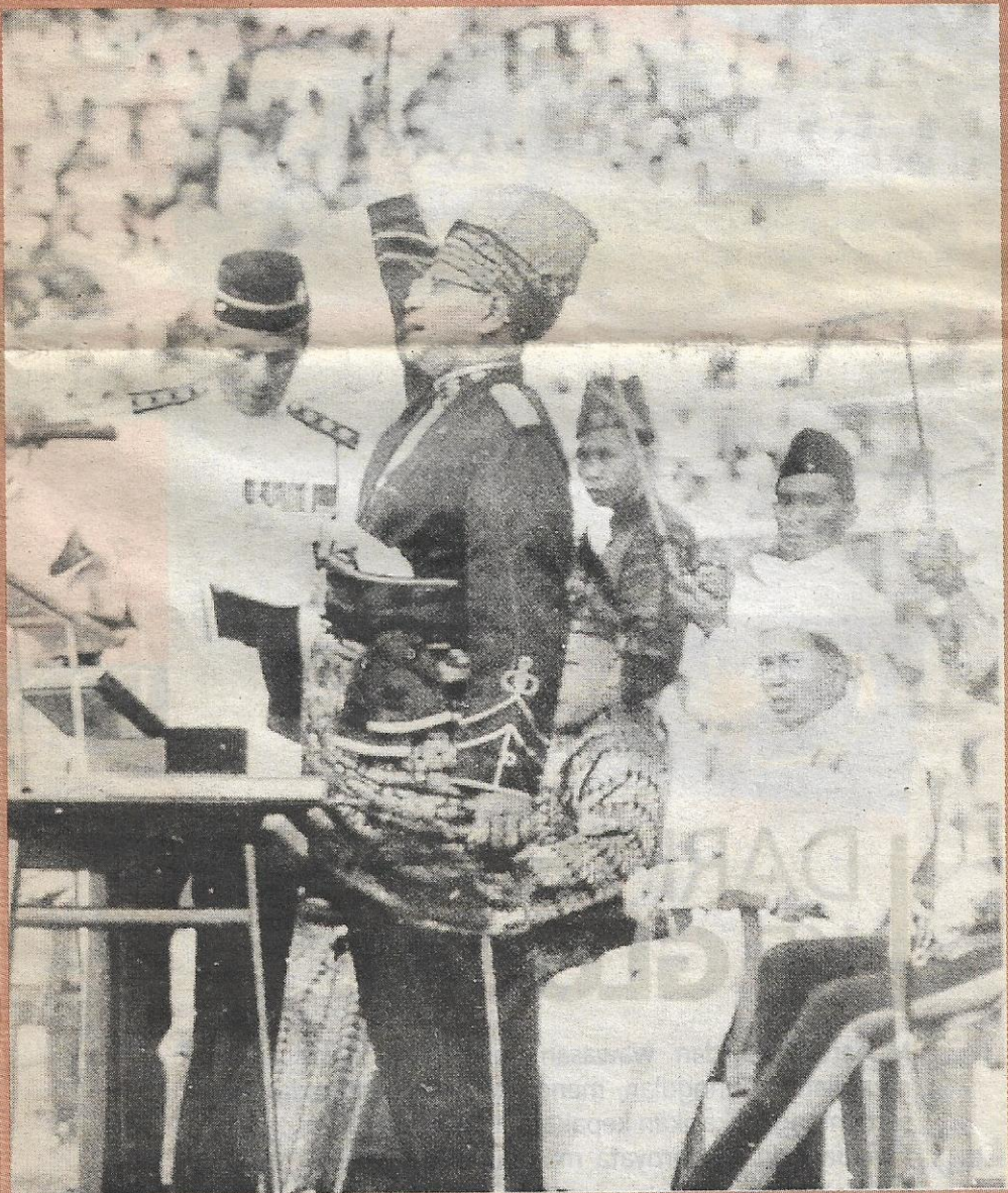
TUNKU ABDUL RAHMAN melaungkan Merdeka pada pagi 31 Ogos 1957 di Stadium Merdeka.