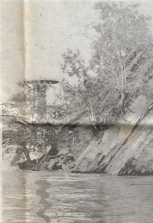
BATU granit berbentuk seperti kapal tenggelam dikai Manis disumpah ibunya kerana menderhaka.

Contohnya, kisah Jong Batu yang ditemui di Sungai Brunei, terletak ke arah barat Istana Nurul Iman adalah mitos mengenai anak derhaka yang tidak asing kepada masyarakat Melayu di Malaysia dan rakyat Indonesia.