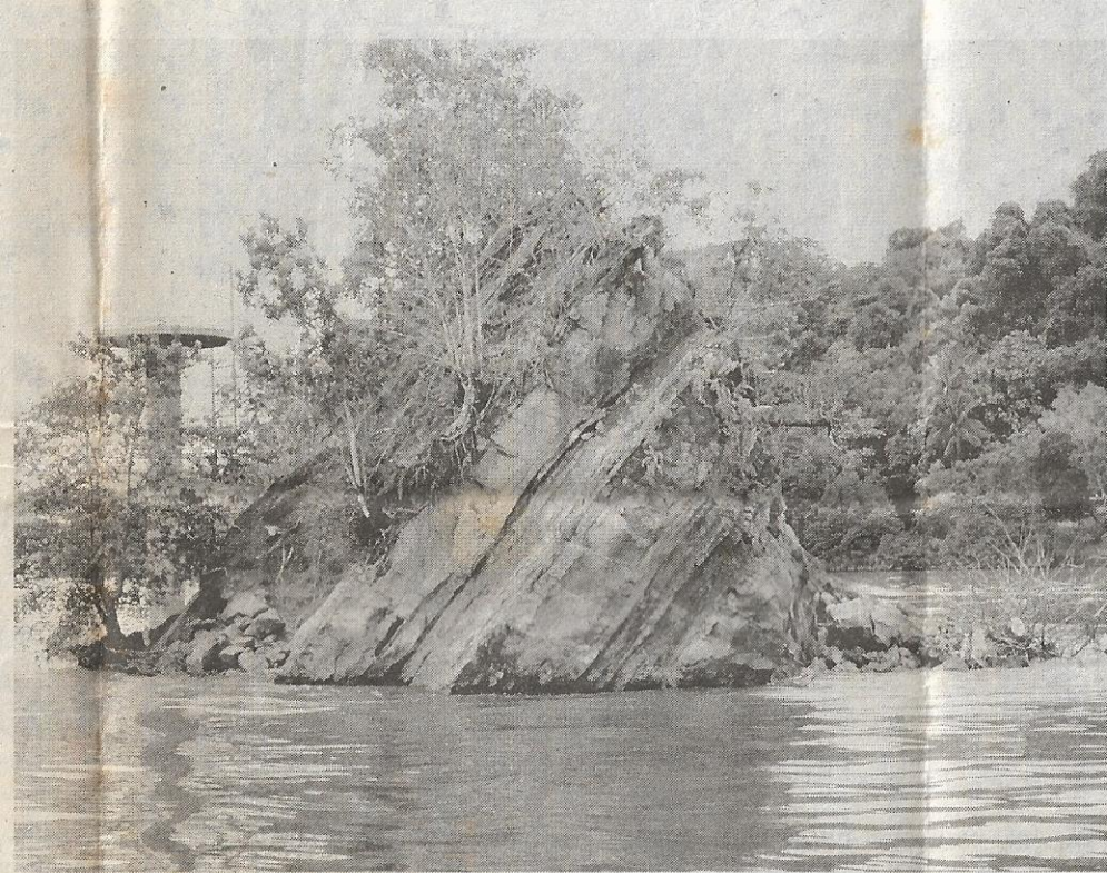
BATU granit berbentuk seperti kapal tenggelam dikaitkan dengan kisah dongeng kapal Nakhoda Manis disumpah ibunya kerana menderhaka.