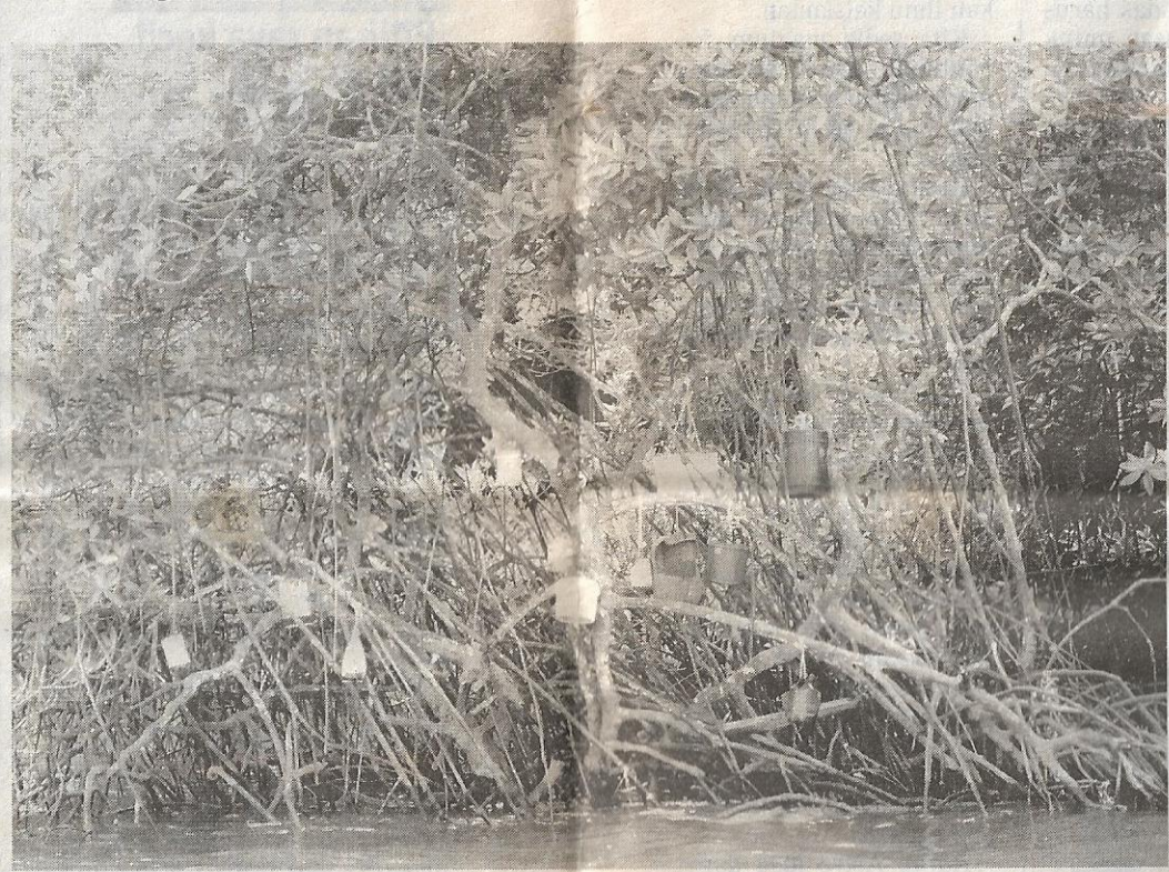
URI yang dibungkus dan diletak dalam tin atau baldi digantung pada ranting pokok di tebing sungai antara budaya diamalkan penduduk Kampong Ayer.