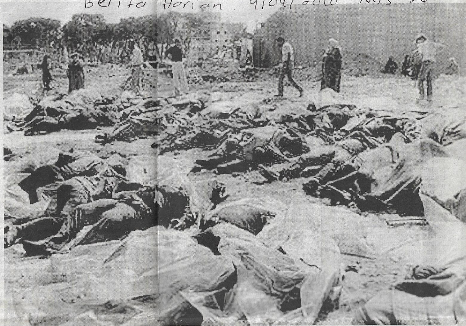
PEMBUNUHAN beramai-ramai di perkampungan Deir Yassin menjadi titik mula penubuhan negara Israel yang menyebabkan rakyat Palestin terus menderita hingga kini.

Peserta yang hadir di dewan Institut Antarabangsa Kajian Tinggi Islam Malaysia (IAIS) di ibu negara petang Ahad lalu untuk mendengar ceramah wartawan akhbar Britain, The Independent , Dr Robert Fisk, pasti merasai penderitaan serta trauma dilalui wa-