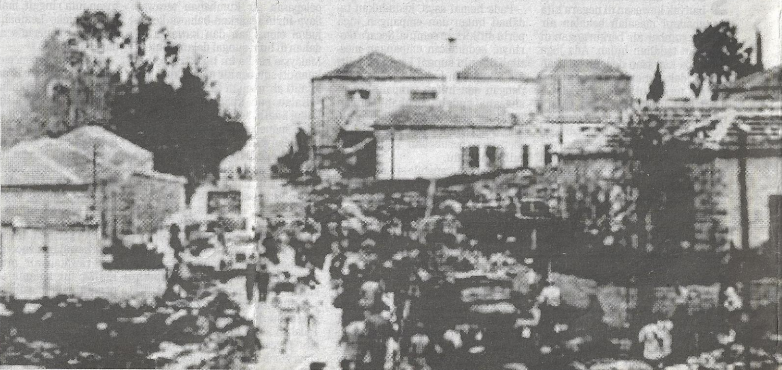
TRAGEDI di perkampungan Deir Yassin pada April 1948 dikenang sebagai malapetaka kepada rakyat Palestin.

"Saya terbaca laporan kejadian di Thailand yang diambil daripada New York Times se-