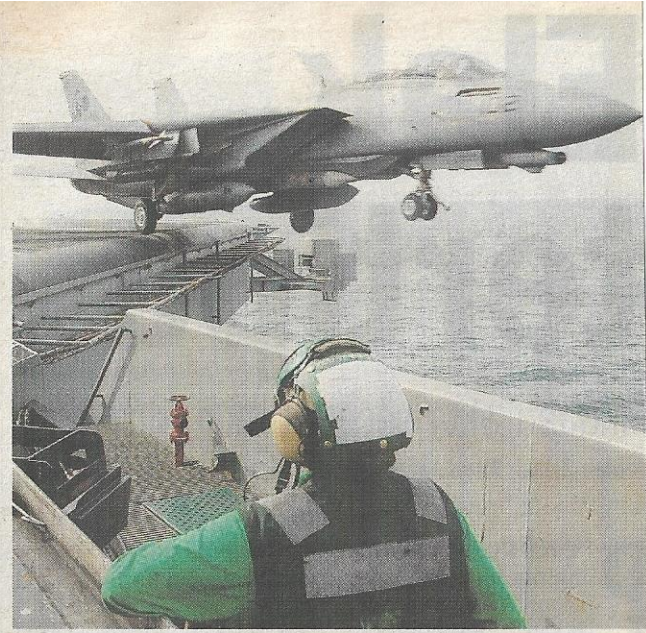
CANGGIH... perlumbaan membeli senjata di negara membangun boleh mencetuskan kebimbangan negara jiran.

"Negara jiran bertindak balas dengan membuat tem-