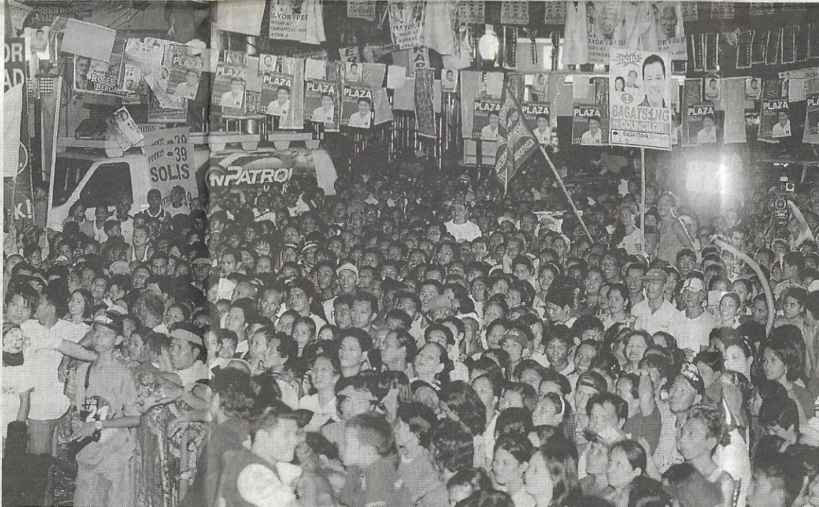
PENYOKONG yang hadir mendengar ceramah calon parti bertanding pada pilihan raya umum Filipina

Namun, pilihan raya umum kali ini turut dipenuhi unsur kejutan seperti larangan minum dan menjual arak di tempat awam bagi rakyatnya dalam tempoh 48 jam iaitu