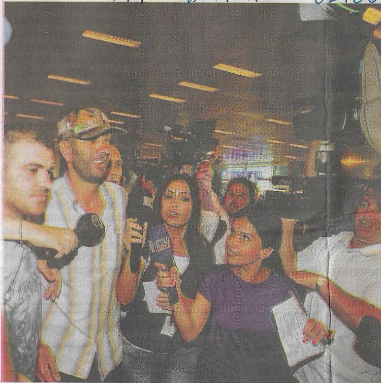
SEORANG anggota krew kapal Turki, Mavi Marmara (dua dari kiri) dikerumuni media sebaik tiba dari Israel di Lapangan Terbang Istanbul, semalam.