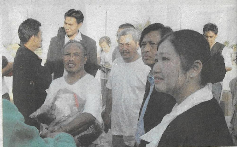
WAJAH-WAJAH ceria sukarelawan Malaysia yang dibebaskan dari Penjara Ela, Israel dan kini berada di Amman, Jordan.