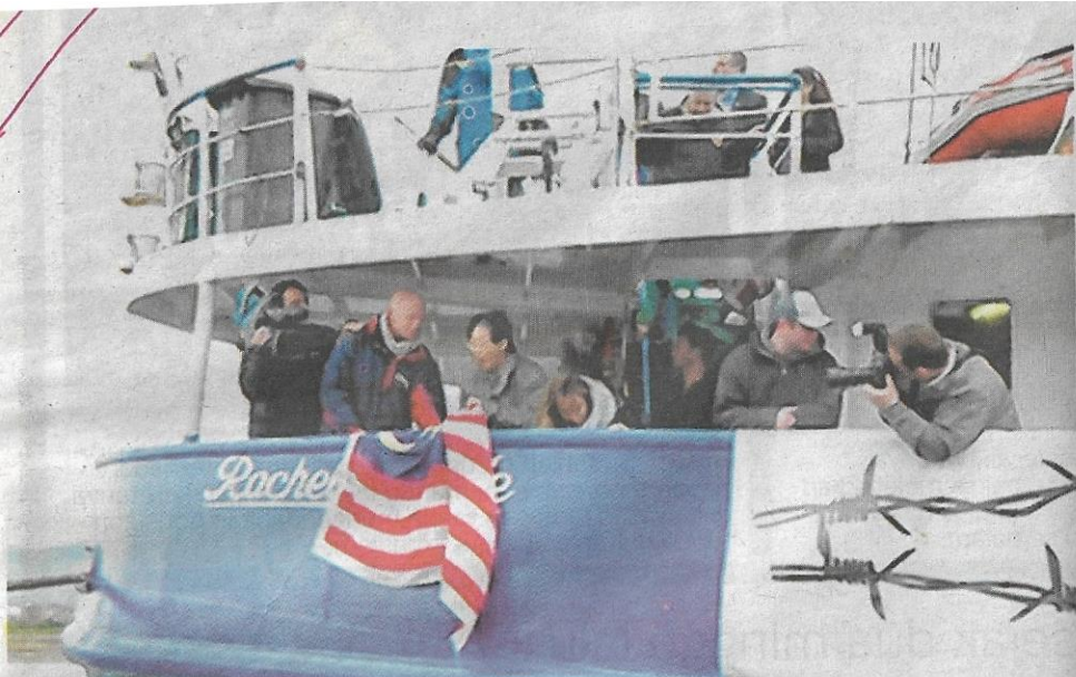
KAPAL Rachel Corrie kini meneruskan pelayaran dan dijangka tiba ke Gaza hari ini biarpun menghadapi halangan pihak berkuasa Israel.