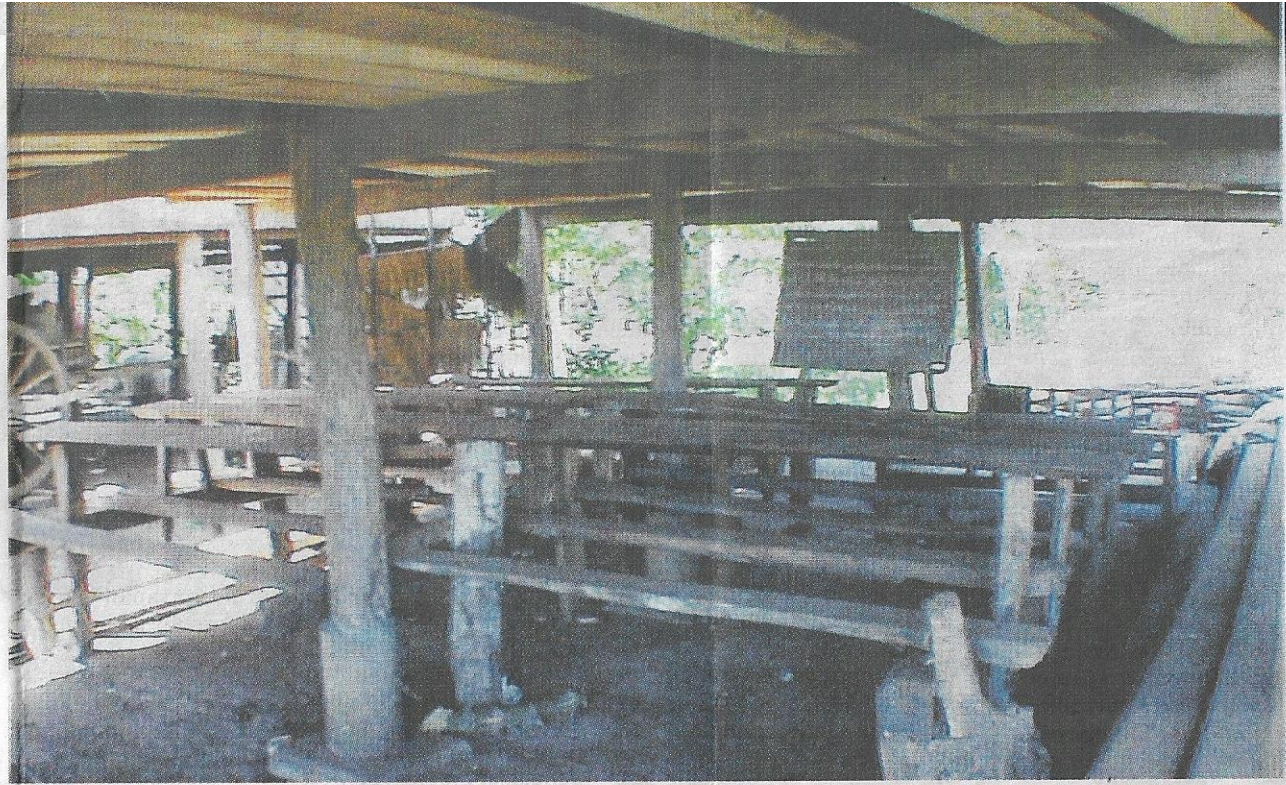
SEKOLAH Agama Bawah Rumah.