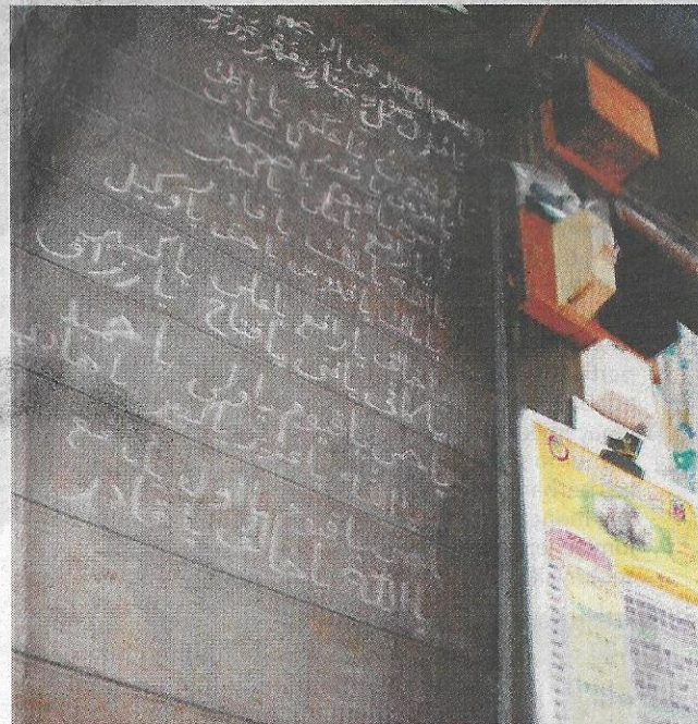
FUNGSI Ruang Dalam Pembelajaran Agama.

gus diharap dapat memupuk integrasi dan keharmonian antara etnik dan merealisasikan konsep 1Malaysia,” katanya.