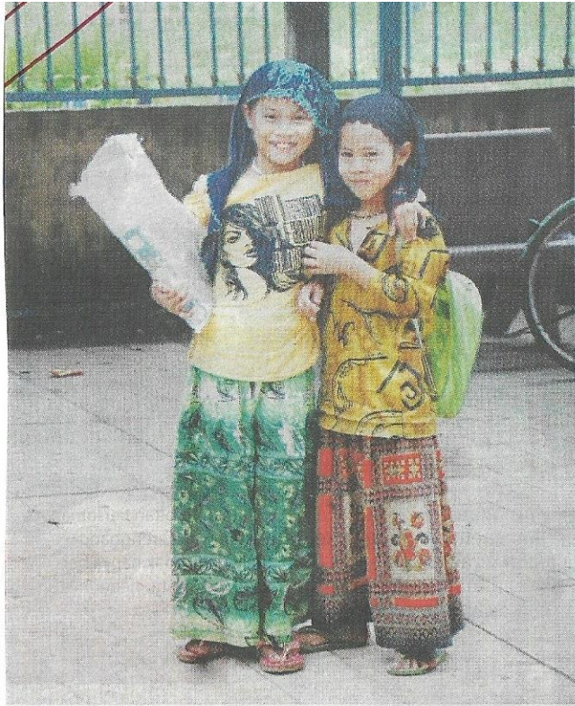
WAJAH ceria kanak-kanak Cam.