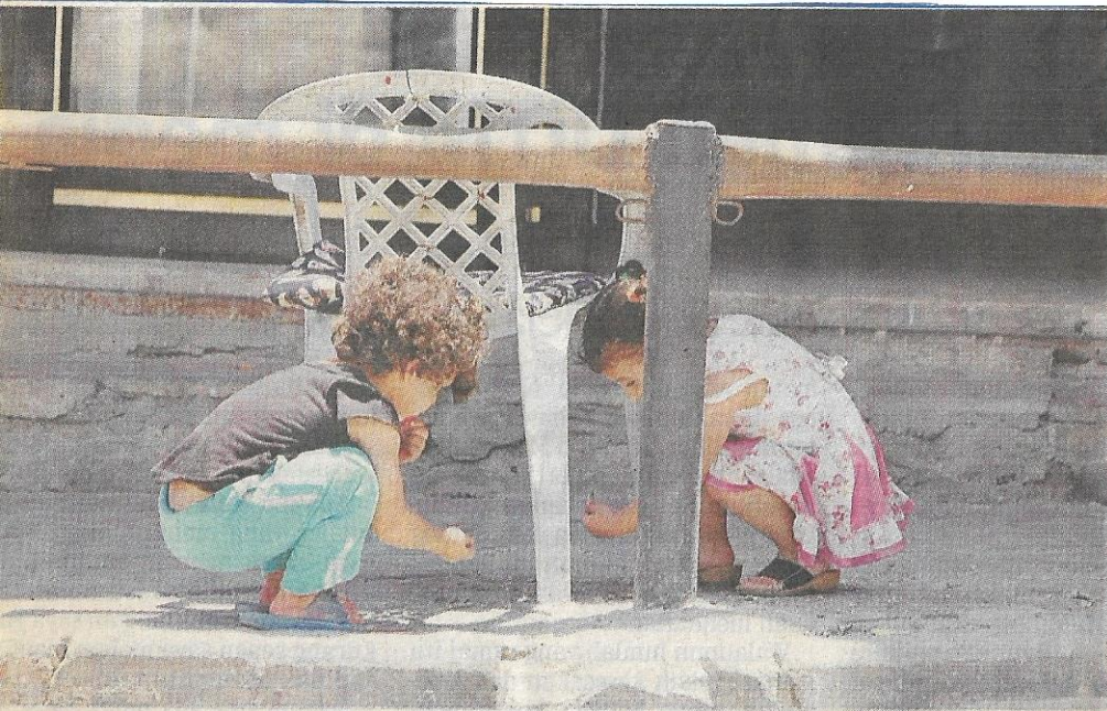
DUA kanak kanak mengutip sisa makanan di tepi jalan bandar Khan Yunis untuk mengalas perut akibat sekatan Israel terhadap pelbagai bantuan kemanusiaan.