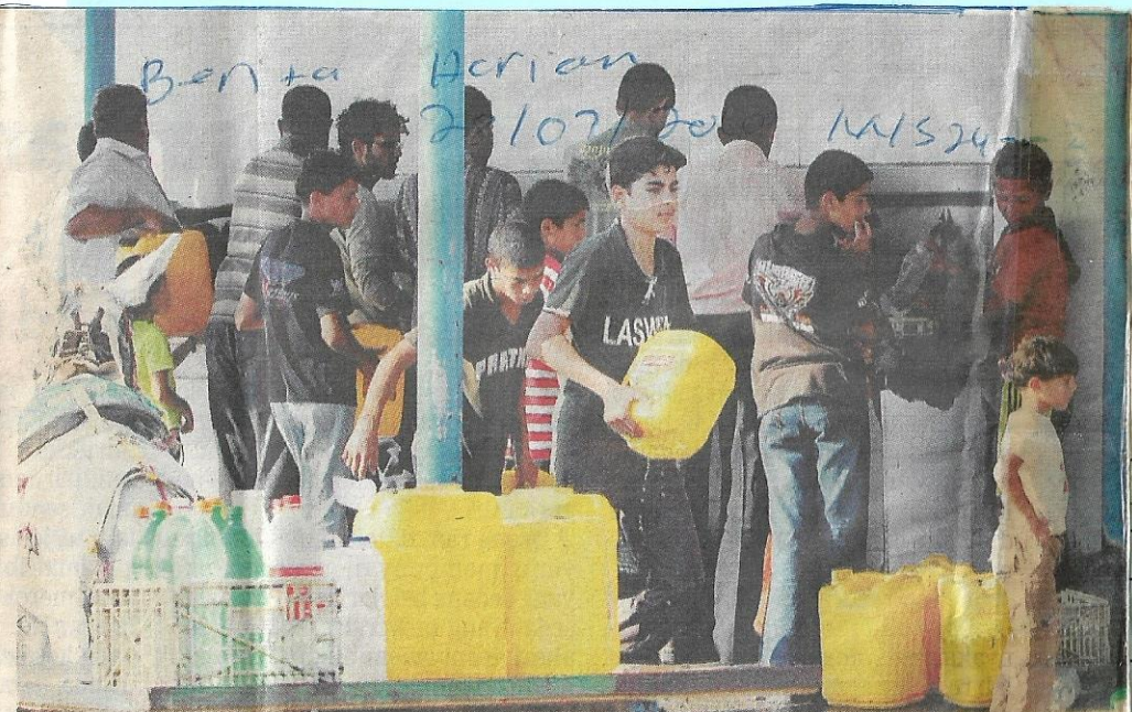
PENDUDUK Gaza terpaksa beratur untuk mengambil air bersih yang ditapis sebagai air minuman di bandar Gaza akibat pengurusan air bersih belum pulih sejak serangan Disember 2008.