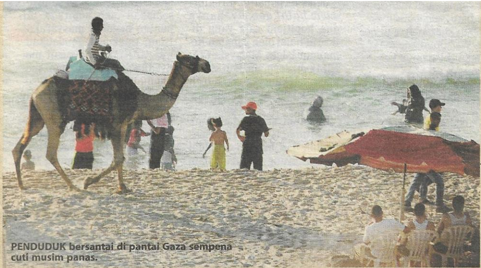
PENDUDUK bersantai di pantai Gaza sempena cuti musim panas.