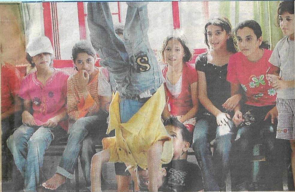
KANAK-KANAK Palestin membuat persembahan tarian tradisional kepada rombongan sukarelawan PBSM di Pusat Psikososial Al-Amal.