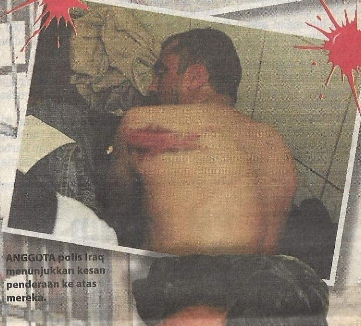
ANGGOTA polis Iraq menunjukkan kesan penderaan ke atas mereka.