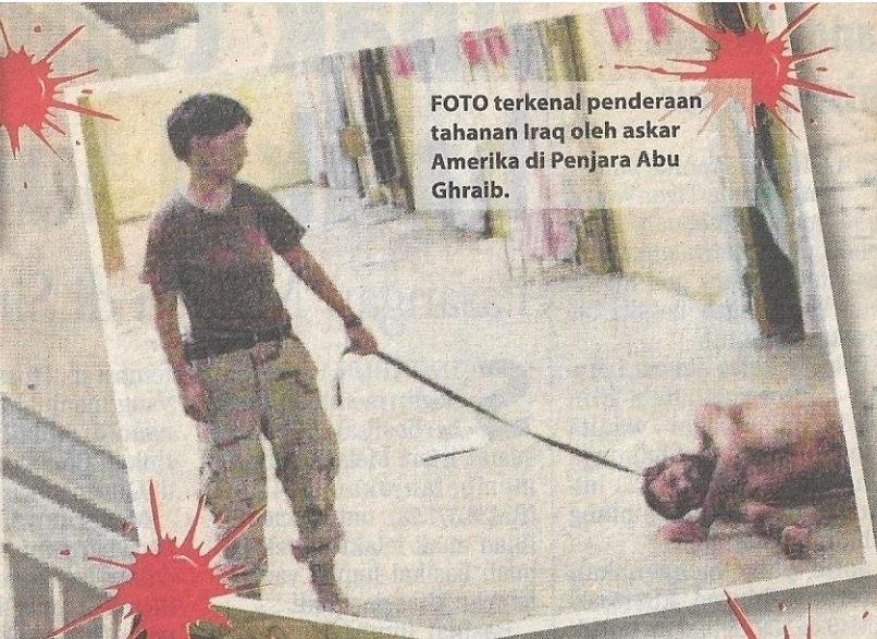
FOTO terkenal penderaan tahanan Iraq oleh askar Amerika di Penjara Abu Ghraib.

Angka serbuan ke atas rumah orang awam di Iraq ketara dalam kes kematian orang awam serta dalam serbuan sebelum fajar di sebuah bandar di Rutba pada 11 September 2005. Walaupun tiada siapa dalam rumah terabit berusia lebih 10 tahun,