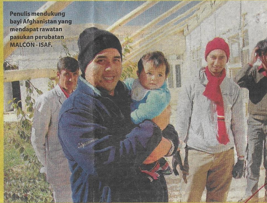
Penulis mendukung bayi Afghanistan yang mendapat rawatan pasukan perubatan MALCON - ISAF.