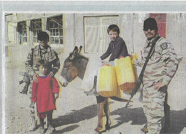
Kehadiran MALCON - ISAF begitu disenangi penduduk setempat yang mengagumi keprihatinan Malaysia dalam usaha membangunkan semula negara mereka.