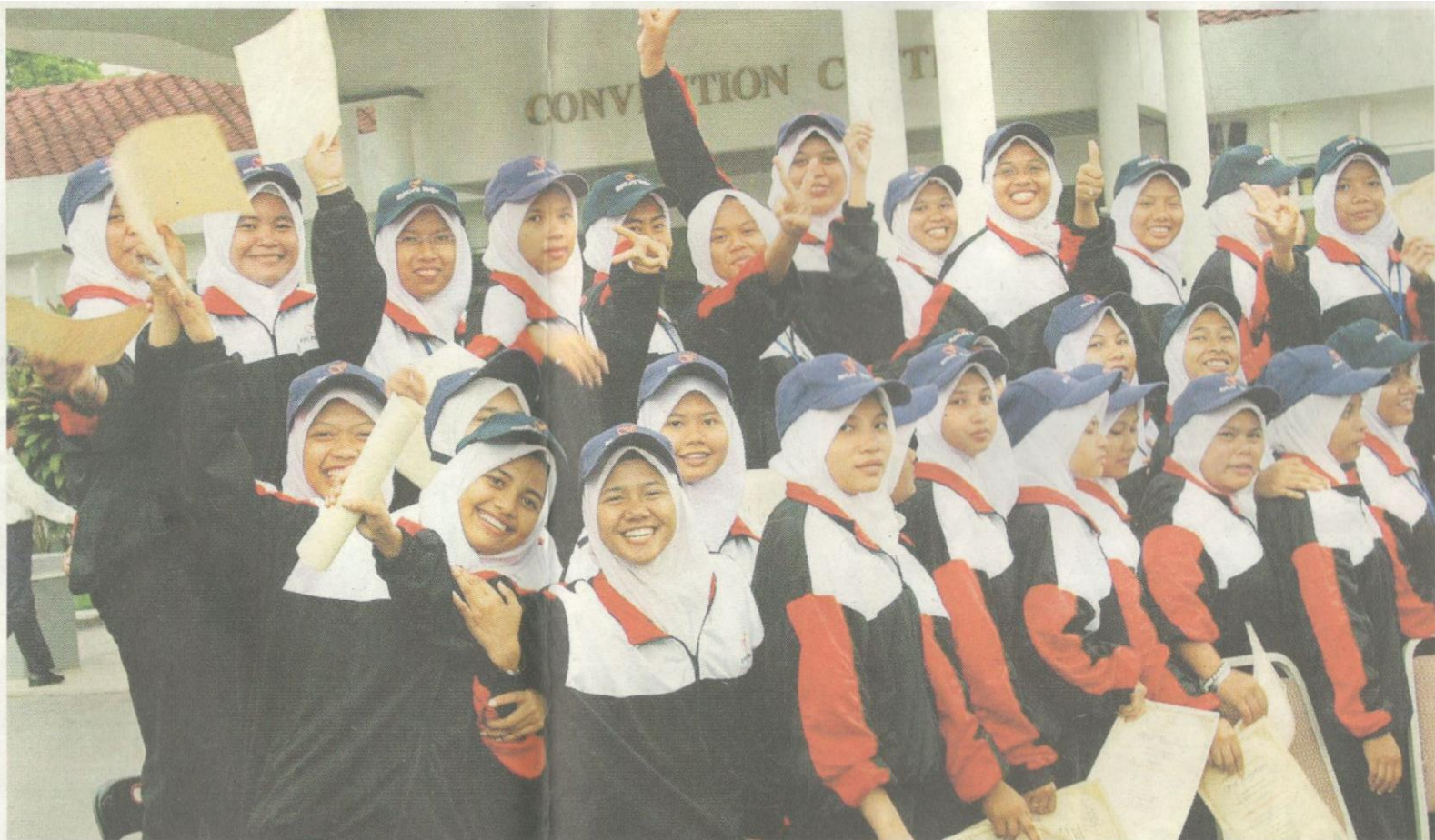
Penekanan terhadap peningkatan daya kemahiran khusus di kalangan generasi muda menjadi keutamaan Felda.

Menyedari cabaran yang dihadapi Felda kini berbeza sewaktu di awal penubuhannya, sumbangan dan bantuan terutama dari segi garapan idea amat diperlukan daripada