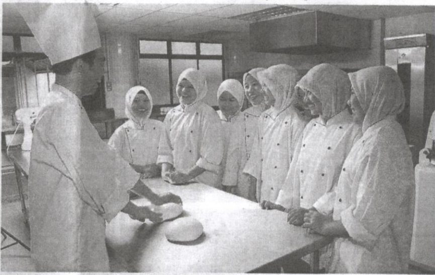
Kursus bakeri dan pastru dengan tenaga pengajar berpengalaman bagi membantu anak-anak Felda.