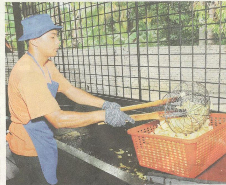
Industri ringan turut diberi penekanan sebagai salah satu pembangunan Felda.