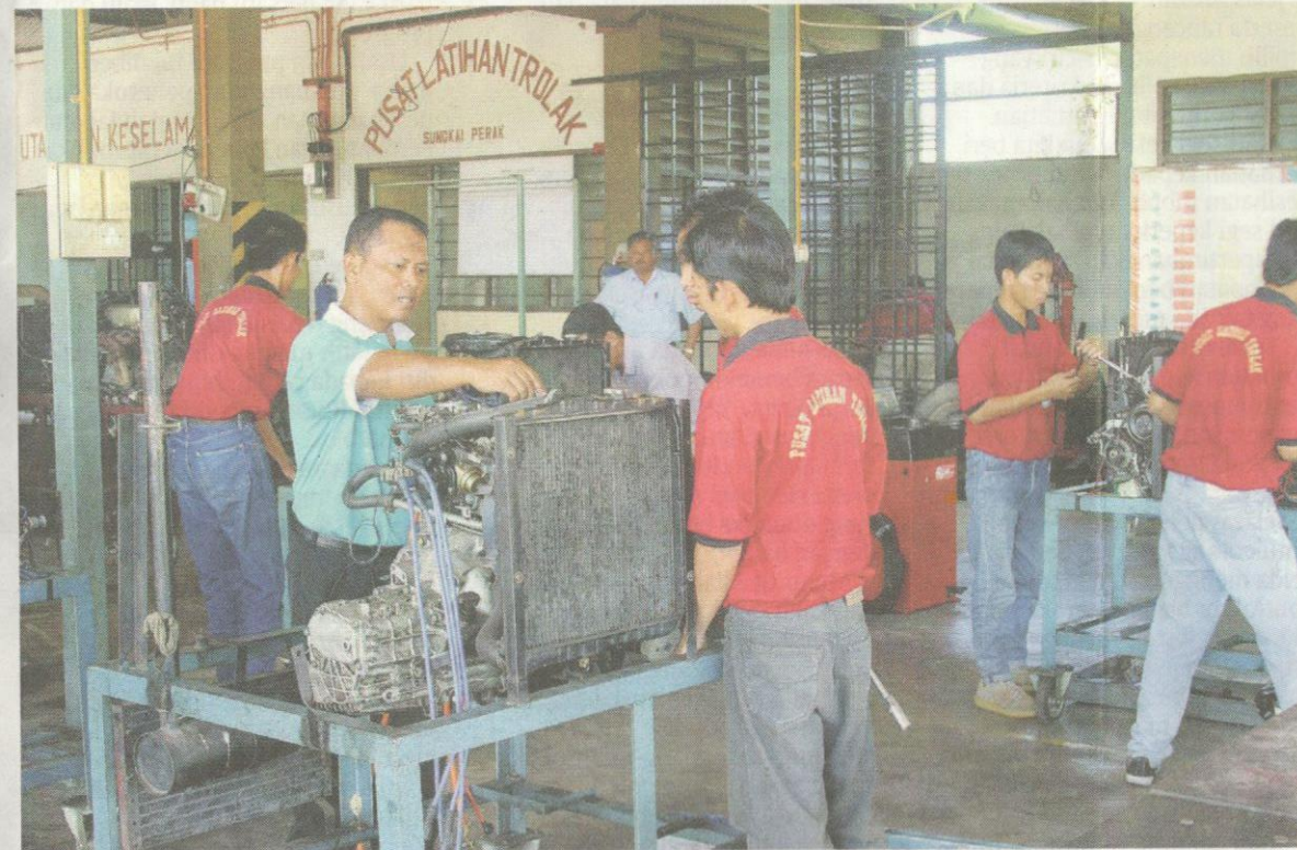
Pusat latihan banyak disediakan untuk mengasah kemahiran anak-anak Felda.

“Kelima-lima tunggak ini akan didorong oleh infrastruktur bertaraf tinggi serta komuniti yang kaya dengan bakat berkemahiran tinggi bagi mencapai hasrat serta visi Felda,” katanya.