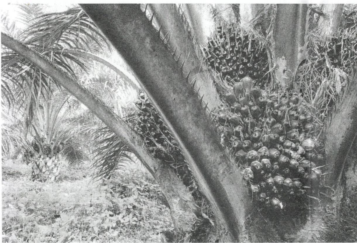
Tanaman kelapa sawit antara tanaman komoditi yang menjadi punca pendapatan utama warga peneroka.

"Felda juga terapkan kemahiran moden, ubah cara bekerja dan wujudkan keluarga yang progresif dan ingin maju," katanya.