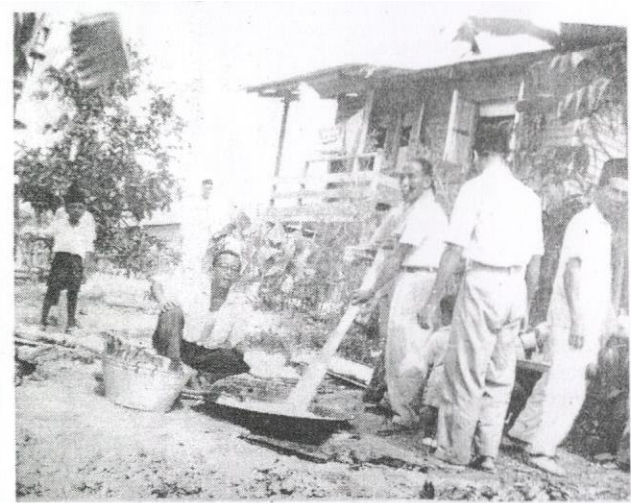
Semangat bergotong-royong telah disemai sejak mula-mula peneroka tiba di tanah rancangan.