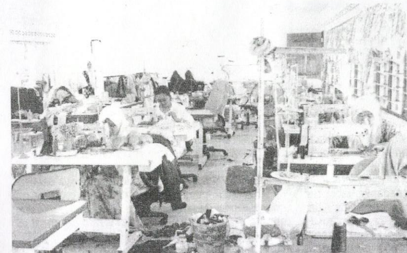
Kelas menjahit turut disediakan bagi golongan wanita sebagai latihan kemahiran untuk mereka memajukan diri.

"Peluang mereka untuk bergerak maju terbuka luas dan diharap mereka akan sentiasa menyokong apa yang dilakukan oleh Felda demi kebaikan mereka pada masa akan datang," ujarnya.