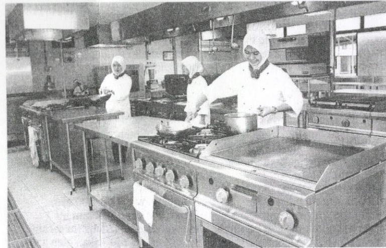
Anak warga peneroka turut tidak ketinggalan mengikuti setiap latihan dan kursus kemahiran yang disediakan.