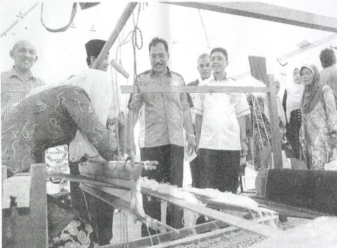
Felda sentiasa memantau golongan peneroka dalam usaha untuk membantu mereka menjana ekonomi.

Malah katanya, pihak Felda sedang membangunkan sebuah