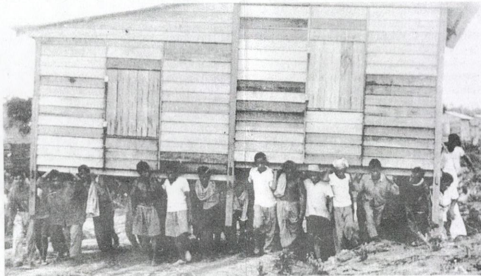
Amalan hidup bersatu-padu menjadi ramuan kesejahteraan warga peneroka.

sepatutnya menghayati secara mendalam maksud di sebalik elemen kesejahteraan yang perlu dilestarikan itu.