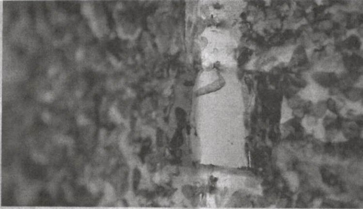
Ulat bungkus betina diletakkan di bahagian tengah dan mengeluarkan feromon.