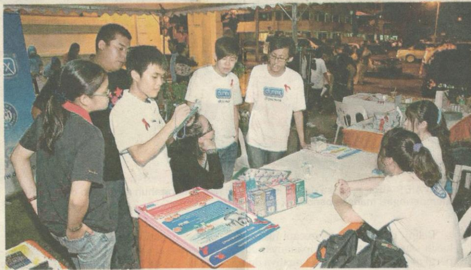
YAYASAN Pink Triangle turut menyambut Hari Memperingati AIDS Sedunia di Kuala Lumpur.

“Atas dasar ini, soko-ongan daripada diri sendiri, keluarga dan komuniti sekeliling diperlukan untuk membantu golongan yang