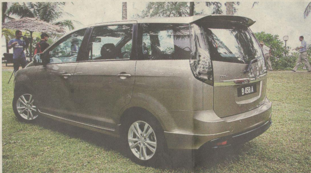
■ Warna baru pada Exora Bold, Cocoa Grey serasi dengan imej baru MPV ini, termasuk rekaan kit badan dan aksesori tambahan yang segar.

Enjin: 1.6L CFE Kuasa maksimum: 138hp @ 5,000rpm Tork maksimum: 205Nm @ 2,000-4,000rpm Transmisi: CVT Ciri-ciri keselamatan: Beg udara, ABS dll. Harga: RM79,998