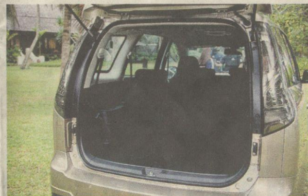
■ Kelebihan ruang kabin yang ada pada Exora kini disempurnakan pula dengan enjin dan kuasa tork yang memberikan pengalaman pemanduan berbeza yang lebih lancar.

Model ini juga mengambil kira penawaran tiga perkara kepada pemilik; penjimatan bahan api, pengurangan kadar pencemaran serta keselesaan perjalanan. Dengan jelmaan terbaru ini, Exora Bold mampu memberikan semua itu. Sebagai contoh, ketika tangki petrolnya mencecah separuh