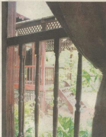
PANDANGAN dari ruang tamu yang memperlihatkan anjung rumah.

“Nilai sentimental rumah ini bukan sahaja terletak pada binaan-