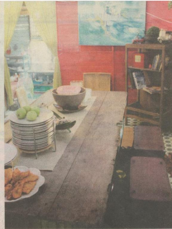
ALAS meja makan yang diambil dari papan pintu lama dan kerusi panjang pembangkit nuansa klasik.