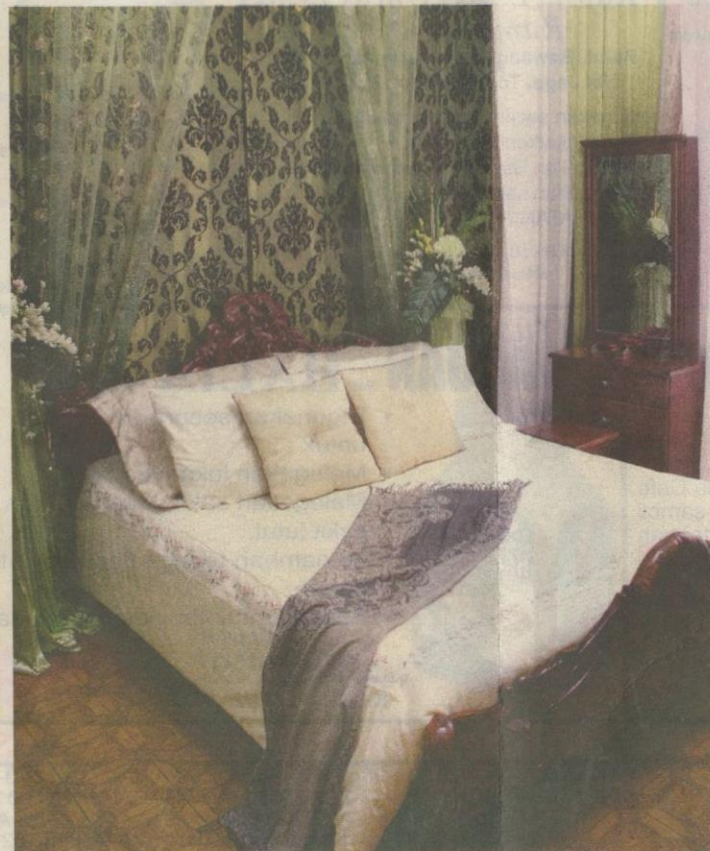
TIDAK sarat dengan aksesori hiasan, Shahril lebih percaya kepada idea ringkas dan praktikal.