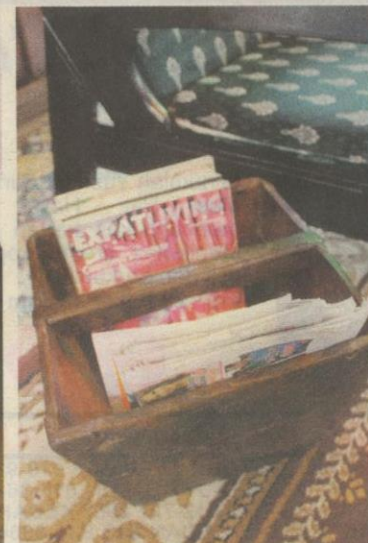
BEKAS air lama dijadikan tempat menyimpan majalah.