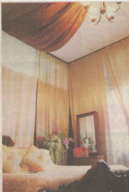
KAMAR tidur yang menerima suntikan idea hiasan kontemporari.

Keunikan: Kediaman warisan ini dibina pada sekitar 1900-an oleh orang tempatan.