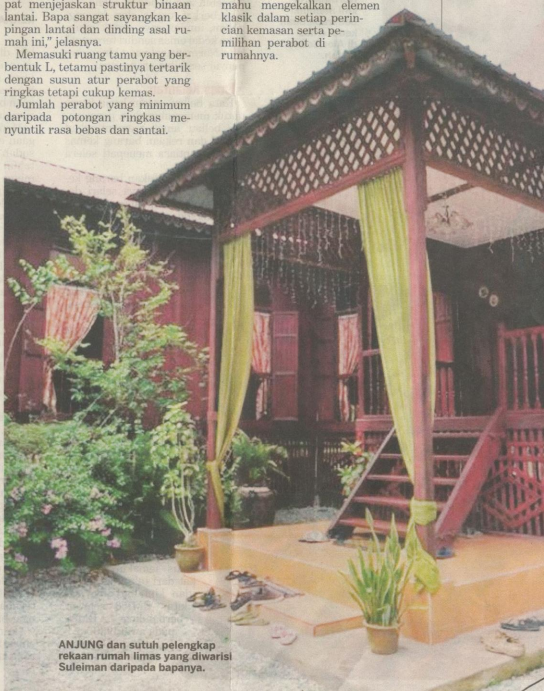
ANJUNG dan sutuh pelengkap rekaan rumah limas yang diwarisi Suleiman daripada bapanya.

Jumlah perabot yang minimum daripada potongan ringkas menyuntik rasa bebas dan santai.