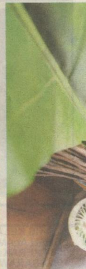
RINGKAS tapi mesra dengan nuansa klasik.