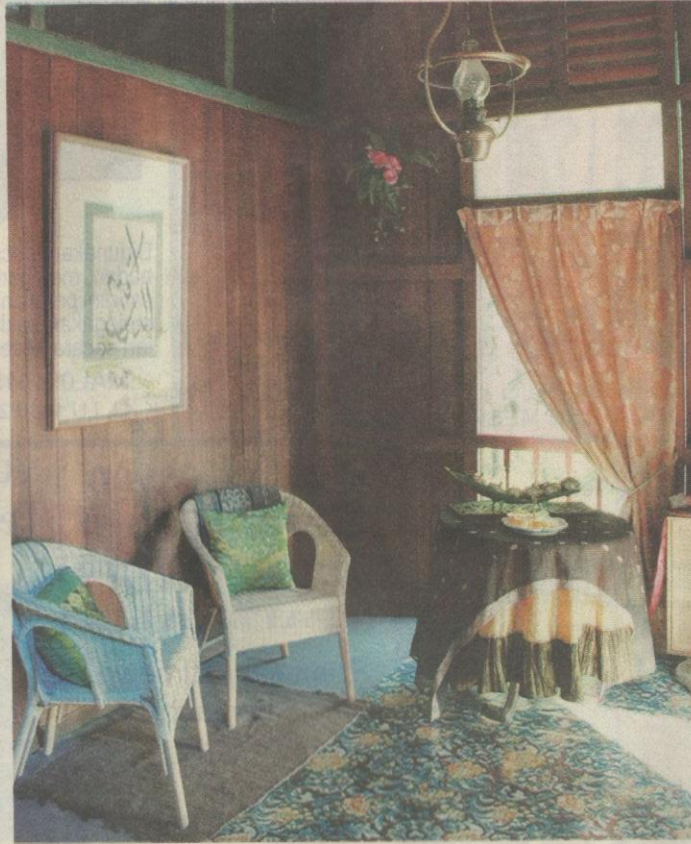
SUDUT wajib pandang sebelum tetamu pulang.