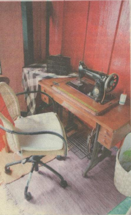
...NG menjahit khusus buat ibu tersayang.