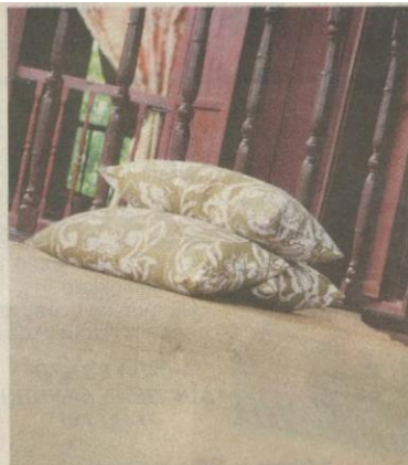
RONA tanah mendominasi keseluruhan kediaman pusaka ini.