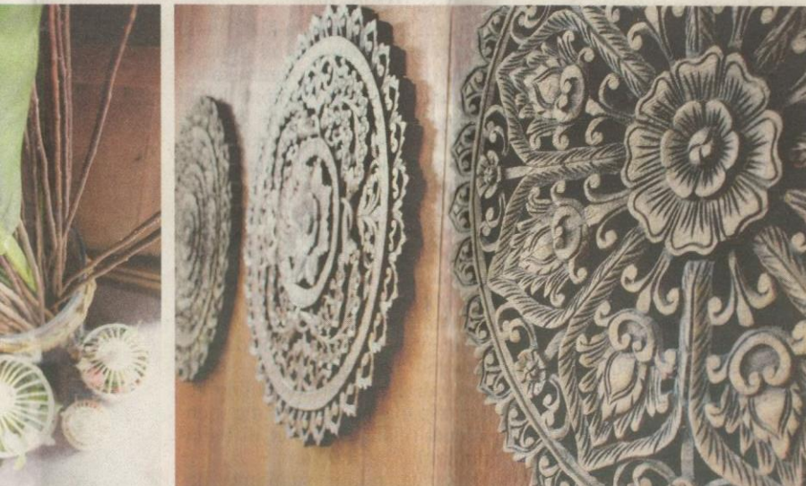
LEKAPAN ukiran bunga berdiameter lebar menjadi tarikan di ruang utama.

"Saya bekerja di Kuala Lumpur dan hanya pulang sekali dua dalam sebulan.