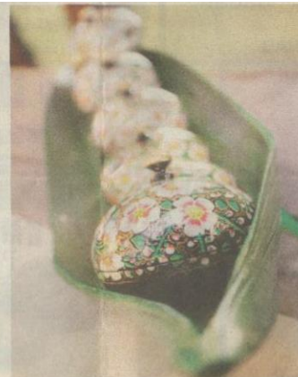
HIASAN unik di meja makan.