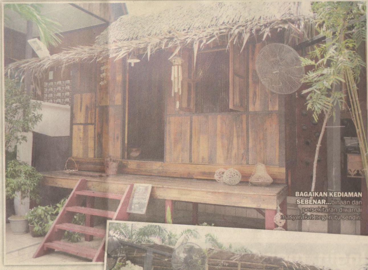
BAGAIKAN KEDIAMAN SEBENAR... binaan dan persekitaran diwarnai masyarakat negeri itu sendiri.

Bermula dengan latar landskap hijau dibarisi pelbagai tanaman terpilih, replika rumah tradisional itu tidak hanya tersergam indah kerana hanya tersergam indah kerana maklumat berkenaan material