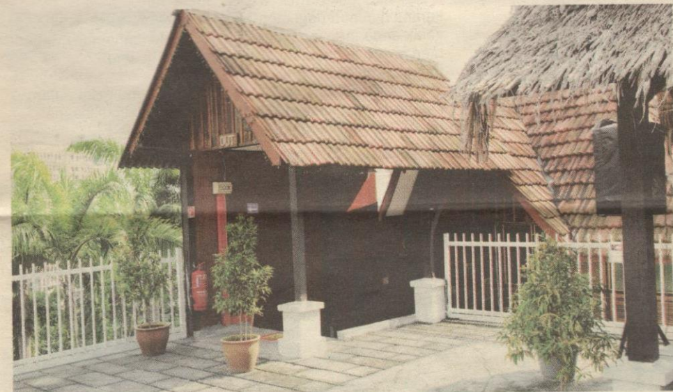
ADA FUNGSI... rasai pengalaman berbeza.