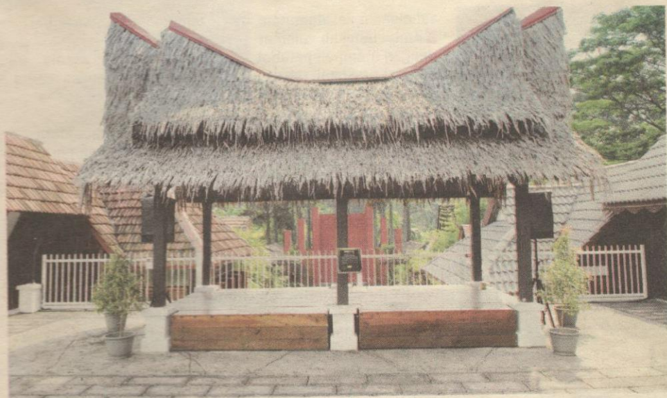
SENTUHAN BERBEZA... latar keindahan bumbung Minangkabau curi perhatian.