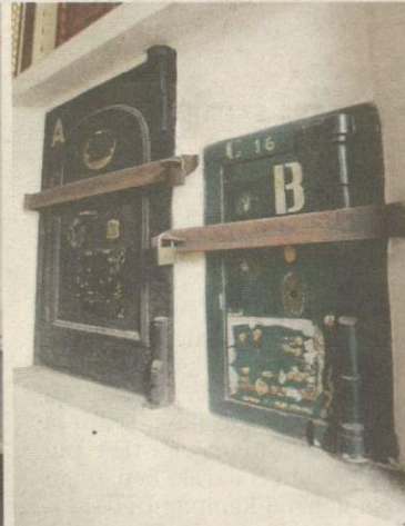
PETI besi ini digunakan untuk menyimpan emas dan barang berharga.

Di lantai bawah, sebaik sahaja memasuki balai lama ini,