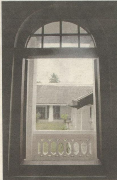
JENDELA kayu di tingkat bawah balai polis membawa pandangan terus ke deretan lokap.