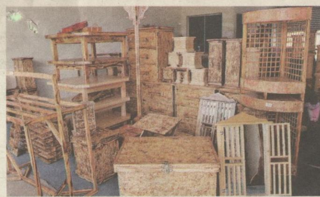
MESKIPUN perabot ini diusahakan hanya oleh empat tenaga kerja, hasilnya sangat bermutu tinggi dan begitu elegan.

Syarikat mereka yang diberi nama Perniagaan Kayu Muhibbah akan