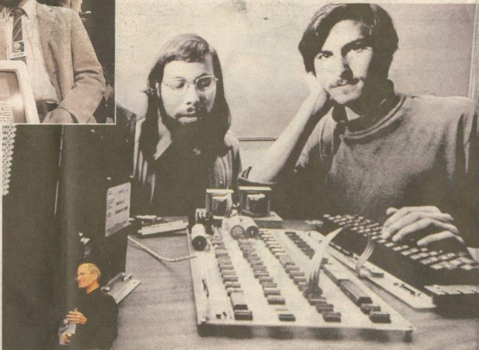
JOB (kanan) bersama Stephen Wozniak membuka syarikat Apple Inc. pada 1 April 1976.

KIRI: Jobs akan menjadi legasi yang tidak mungkin dilupakan dalam sejarah Apple.