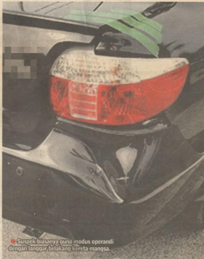
● Suspek biasanya guna modus operandi dengan langgar belakang kereta mangsa.