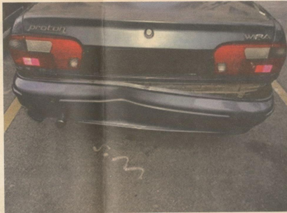
● Kereta dilanggar dari belakang dan kemudian ditinggalkan begitu sahaja.

Kurang didikan agama menyebabkan seseorang diri rapuh tahanan diri dan iman supaya tidak terjebak jenayah kerana tiada rasa takut kepada balasan Tuhan terhadap perbuatan itu.