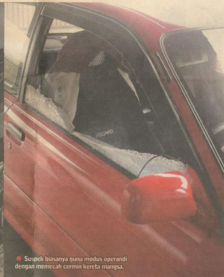
● Suspek biasanya guna modus operandi dengan memecah cermin kereta mangsa.