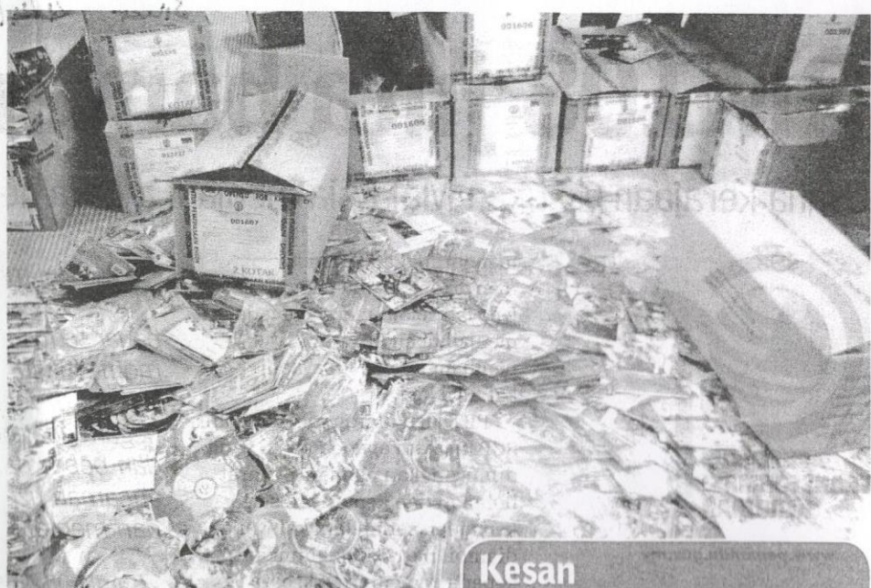
● Antara VCD, DVD yang dijual termasuk filem luar dan juga filem tempatan.