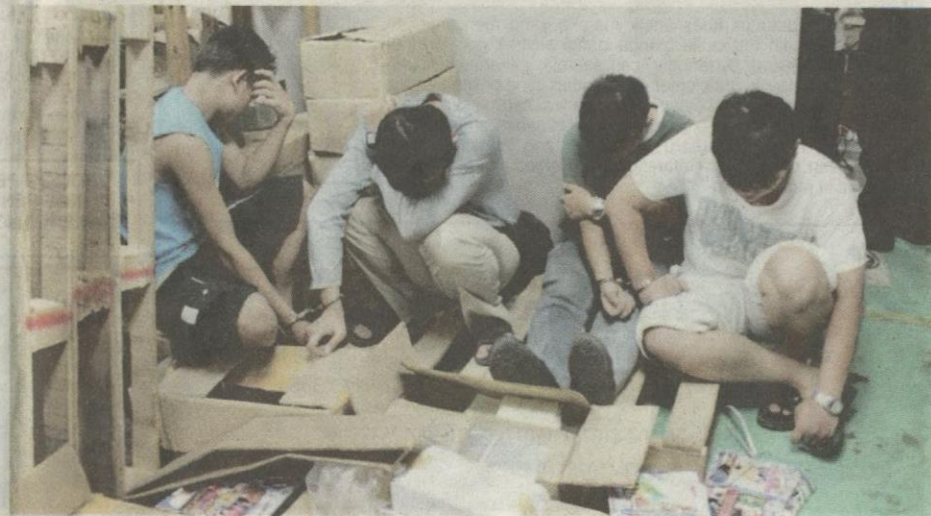
● Kegiatan cetak rompak selalunya dilakukan berkumpulan.