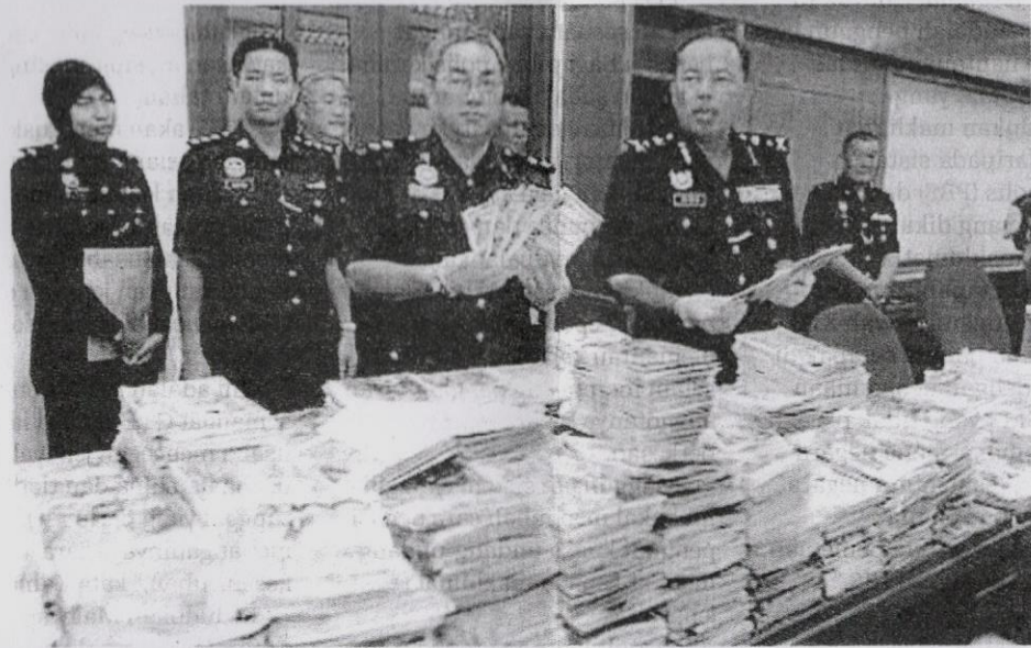
● Rampasan VCD dan DVD cetak rompak.

...gambar, membuat salinan secara elek- tronik atau komputer, fotostat, rakam- an video, rakaman suara, menaip se- mula atau diubah kepada PDF.