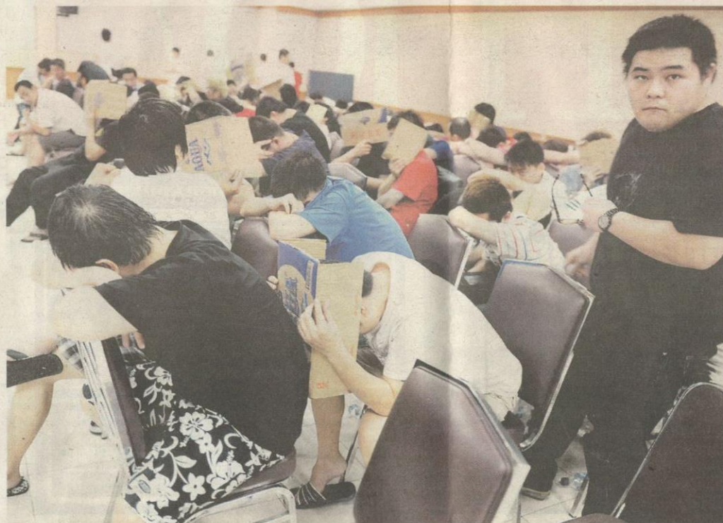
SEBAHAGIAN daripada 177 warga Taiwan dan China yang terbabit dalam penipuan siber ditahan oleh Imigresen Indonesia di Jakarta kelmarin.

Mereka membuat panggilan secara Suara Melalui Protokol Internet (VOIP) kepada