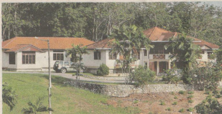
BANGLO yang cuba dipecah masuk oleh empat penjenayah di Kampung Pedas Tengah, Rembau semalam.

gunakan parang," katanya pada sidang akhbar di sini semalam.