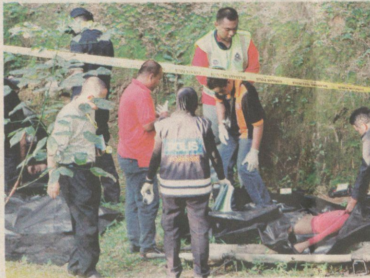
ANGGOTA polis memeriksa mayat salah seorang daripada tiga penjenayah warga Indonesia yang mati ditembak di Kampung Pedas Tengah, Rembau semalam.

"Bagaimanapun, ketika hendak melarikan diri, mereka terserempak dengan sepasukan polis yang sedang melakukan rondaan di ladang kelapa sawit tersebut. Mereka bukan sahaja enggan menurut arahan supaya menyerah diri malah menyerang polis dengan meng-