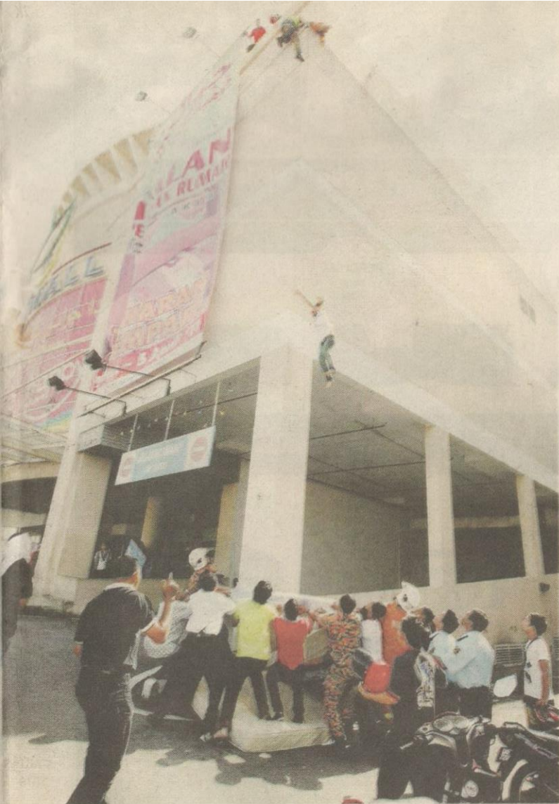
PUTUS cinta dipercayai antara punca mendorong seseorang itu membunuh diri.