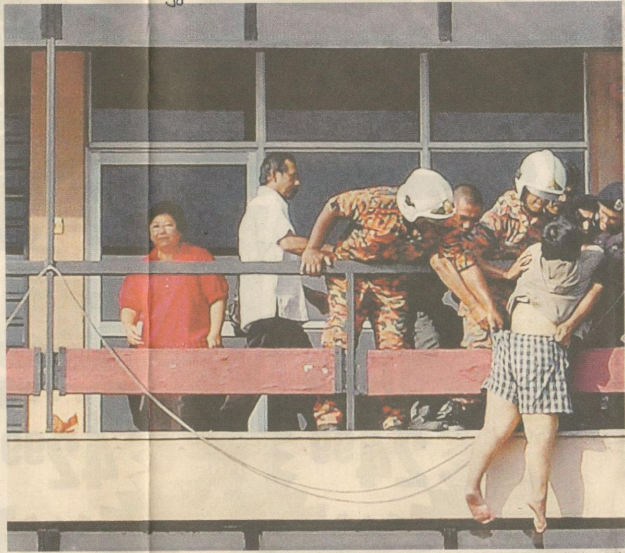
PIHAK bertanggungjawab perlu mengambil inisiatif segera untuk menangani bunuh diri kerana ia semakin menjadi jalan mudah