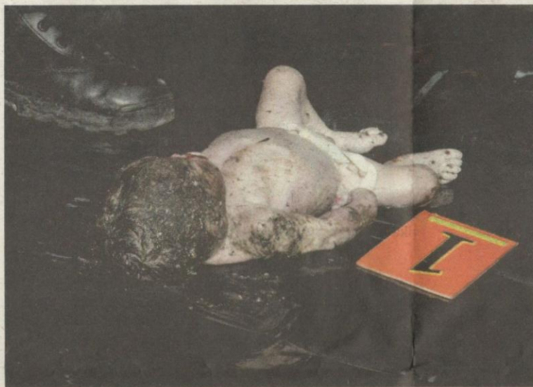
KEADAAN mayat bayi yang ditemui dalam longkang.

percaya baru dilahirkan kerana masih mempunyai tali pusat.