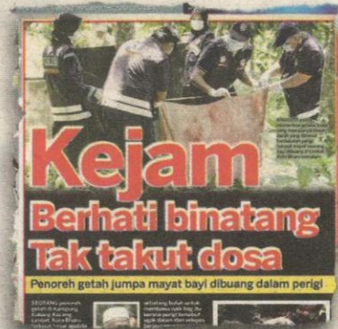
KERATAN muka depan Kosmo! semalam.

Kes tersebut disiasat mengikut Seksyen 318 Kanun Keseksaan iaitu menyembunyikan kelahiran dengan membuang mayat.