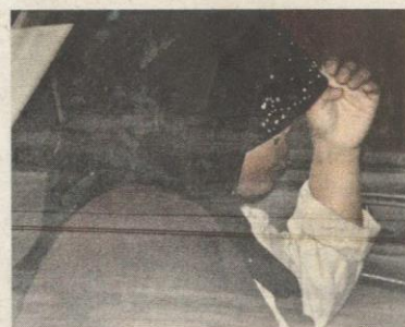
GADIS yang disyaki mencampak anaknya ke dalam longkang.

Suspek mendakwa bayi terbabit sudah tidak bernyawa menyebabkan dia membuangnya ke dalam longkang