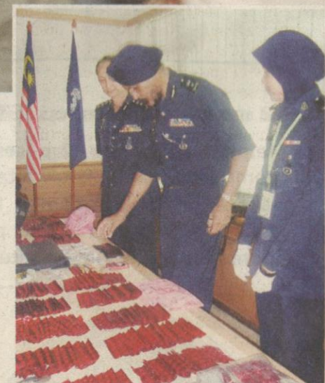
● Sejumlah eramin 5 yang dirampas polis. (gambar hiasan)