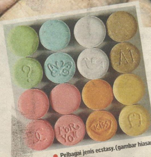
● Pelbagai jenis ecstasy. (gambar hiasan)