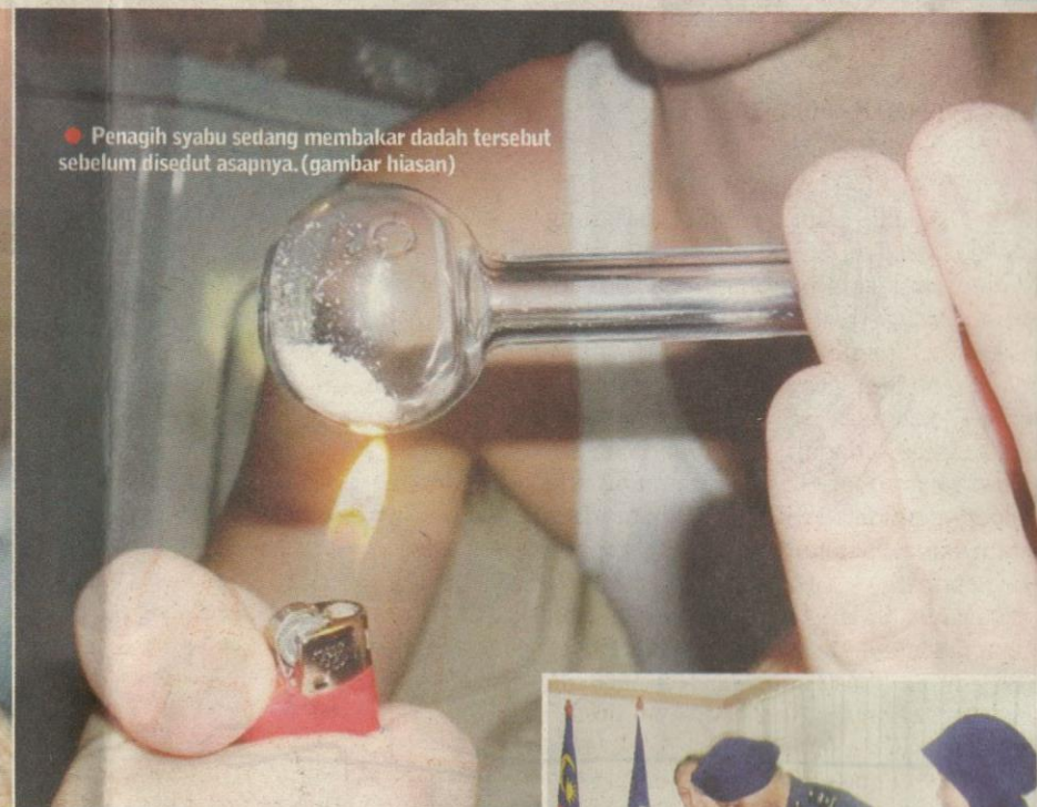
● Penagih syabu sedang membakar dadah tersebut sebelum disedut asapnya. (gambar hiasan)