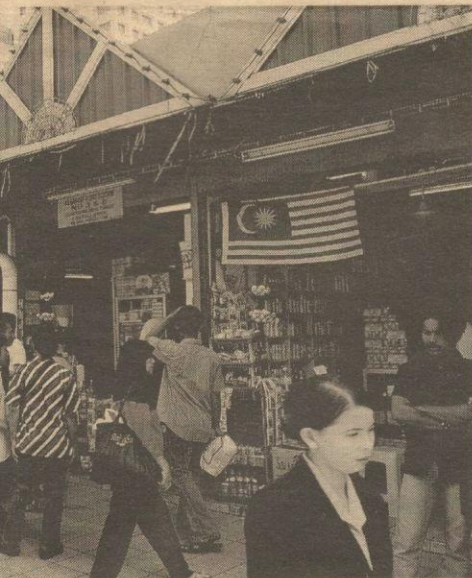
membantu membangunkan ekonomi Bumiputera.

MTAB akan menampilkan satu pelan besar agenda Bumiputera mungkin awal tahun depan ini.