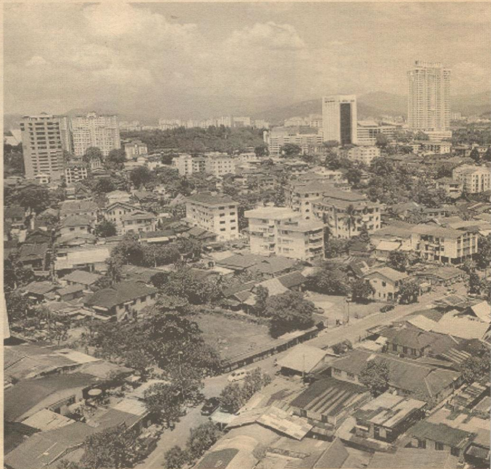
KOMPONEN kemelayuan dalam pembangunan Kuala Lumpur Raya perlu dikekalkan.

“Jadi jelas seperti yang diumumkan oleh Presiden UMNO itu ketika menggulung perbahasan di Perhimpunan Agung UMNO lalu, dan juga dalam banyak kenyataan yang dibuat, hatta dalam perasmian majlis MCA di mana beliau menyatakan dengan jelas bahawa negara yang tidak memberi tempat yang