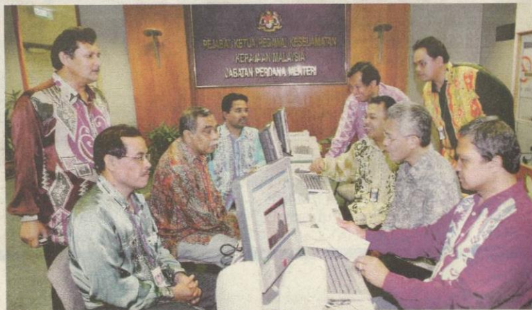
SKIM Saraan Baru Perkhidmatan Awam bakal merangsang produktiviti kakitangan kerajaan. - Gambar hiasan

Beliau menambah, penjawat awam yang menerima opsyen ke