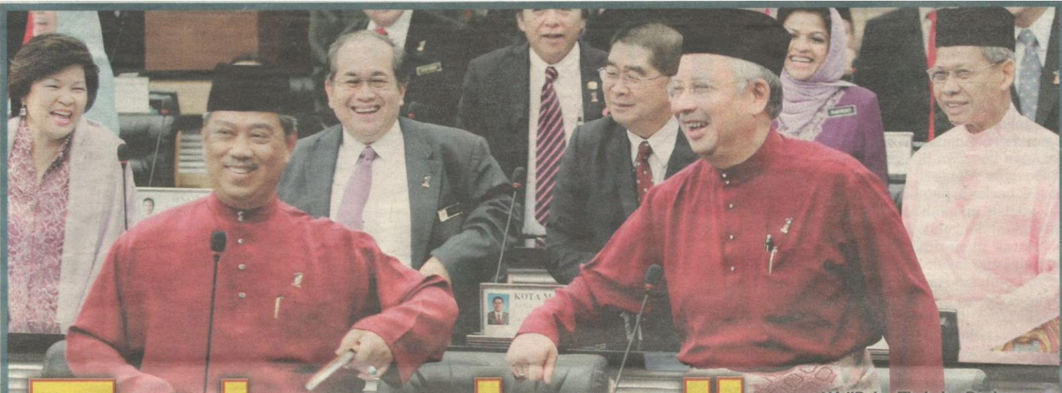
NAJIB dan Timbalan Perdana Menteri, Tan Sri Muhyiddin Yassin dalam suasana ceria selepas pembentangan Bajet 2012 di Dewan Rakyat semalam.