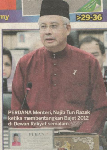
PERDANA Menteri, Najib Tun Razak ketika membentangkan Bajet 2012 di Dewan Rakyat semalam.

Peruntukan RM1.2 bilion untuk program Kebajikan Rakyat 1Malaysia atau KARISMA.