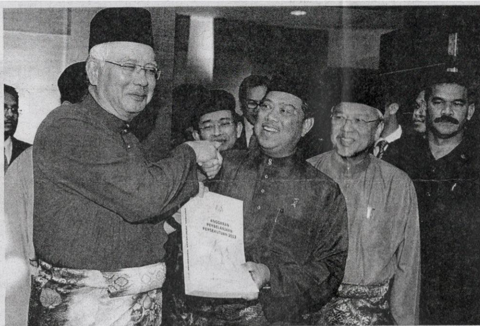
NAJIB dan timbalannya, Tan Sri Muhyiddin Yassin menunjukkan teks ucapan Bajet 2012 selepas pembentangannya di Bangunan Parlimen semalam.

Ia mempunyai lima fokus utama iaitu meligat pelaburan, mengungguli modal insan, mencerna kreativiti dan mencetus inovasi, program transformasi luar bandar, memperkecapi perkhidmatan awam dan me-