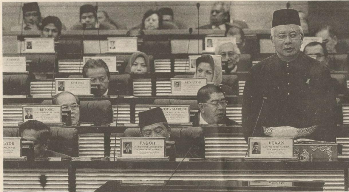
PERDANA Menteri membentangkan Bajet 2012 di Dewan Rakyat, semalam.

Asas ekonomi negara kekal utuh. Sistem kewangan dan perbankan negara terus teguh dengan nisbah modal wajaran risiko adalah 14.8 peratus, jauh melebihi paras keperluan 8 peratus dalam piawaian antarabangsa. Rizab antarabangsa terus kukuh mencatat RM414.5 bilion pada 15 September 2011, mampu membiayai 9.5 bulan import tertanggung serta 4.5 kali hutang luar jangka pendek. Pendapatan per kapita dianggarkan meningkat kepada RM28,725 pada 2011 berbanding