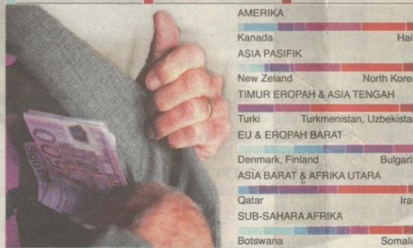
Sumber: Transparency International Gambar: Getty Images © GRAPHIC NEWS