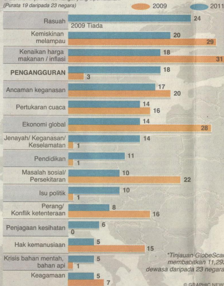
Grafik menunjukkan isu hangat yang diperkatakan. (Purata 19 daripada 23 negara)

*Tinjauan GlobeScan membabitkan 11,293 dewasa daripada 23 negara.