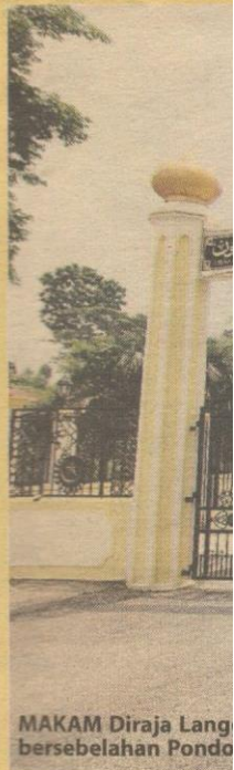
MAKAM Diraja Langgar bersebelahan Pondok