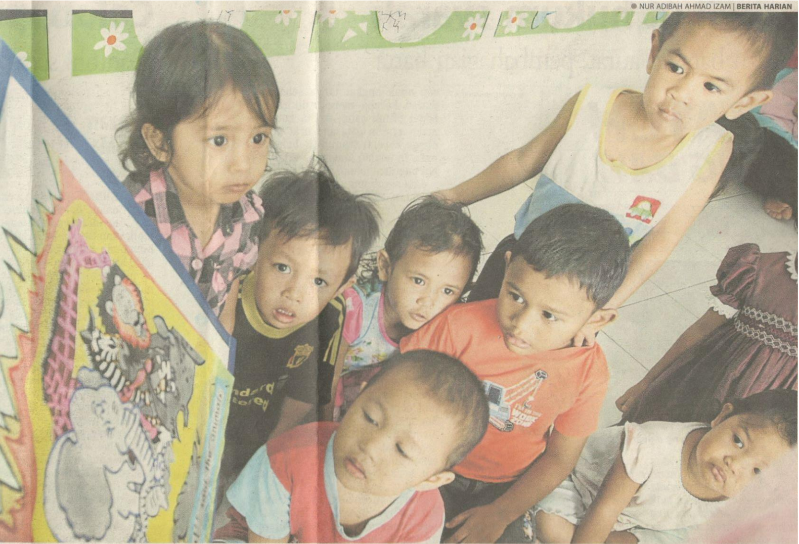
ibus dan kurikulum bagi mengasah minda mereka.