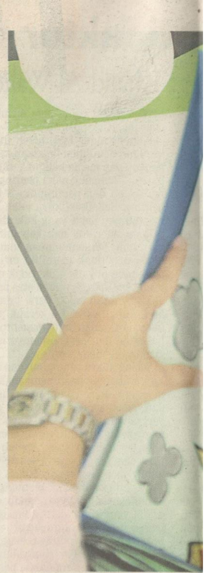
KANAK-KANAK di PERMATA mengikuti

“Kerjasama kerajaan negeri memang penting dalam usaha ini kerana selain menyediakan tempat, ia perlu mengambil kira faktor demografi iaitu melihat kelompok masyarakat di kawasan itu. Jika di FELDA yang kebanyakannya adalah generasi pertama, tentu pembukaan pusat asuhan akan merugikan pada