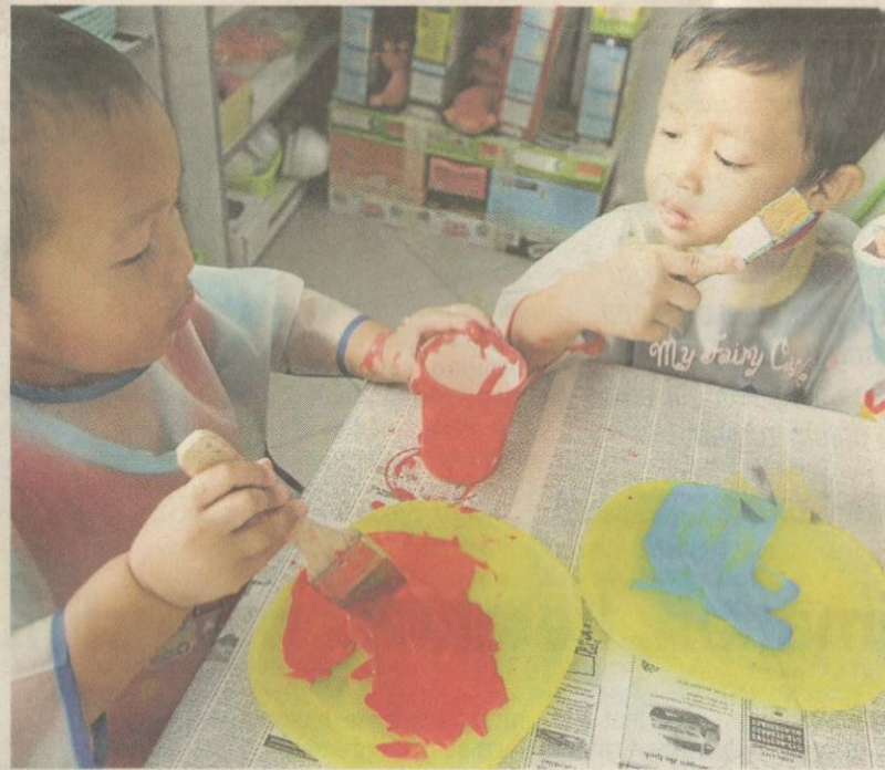
KANAK-KANAK di Pusat PERMATA Putrajaya diajar mewarnakan cawan plastik untuk dibuat hiasan.

ialah satu program khusus yang menyediakan satu unit rumah di Projek Penempatan Rakyat (PPR) untuk digunakan remaja bagi apa saja aktiviti berfaedah.