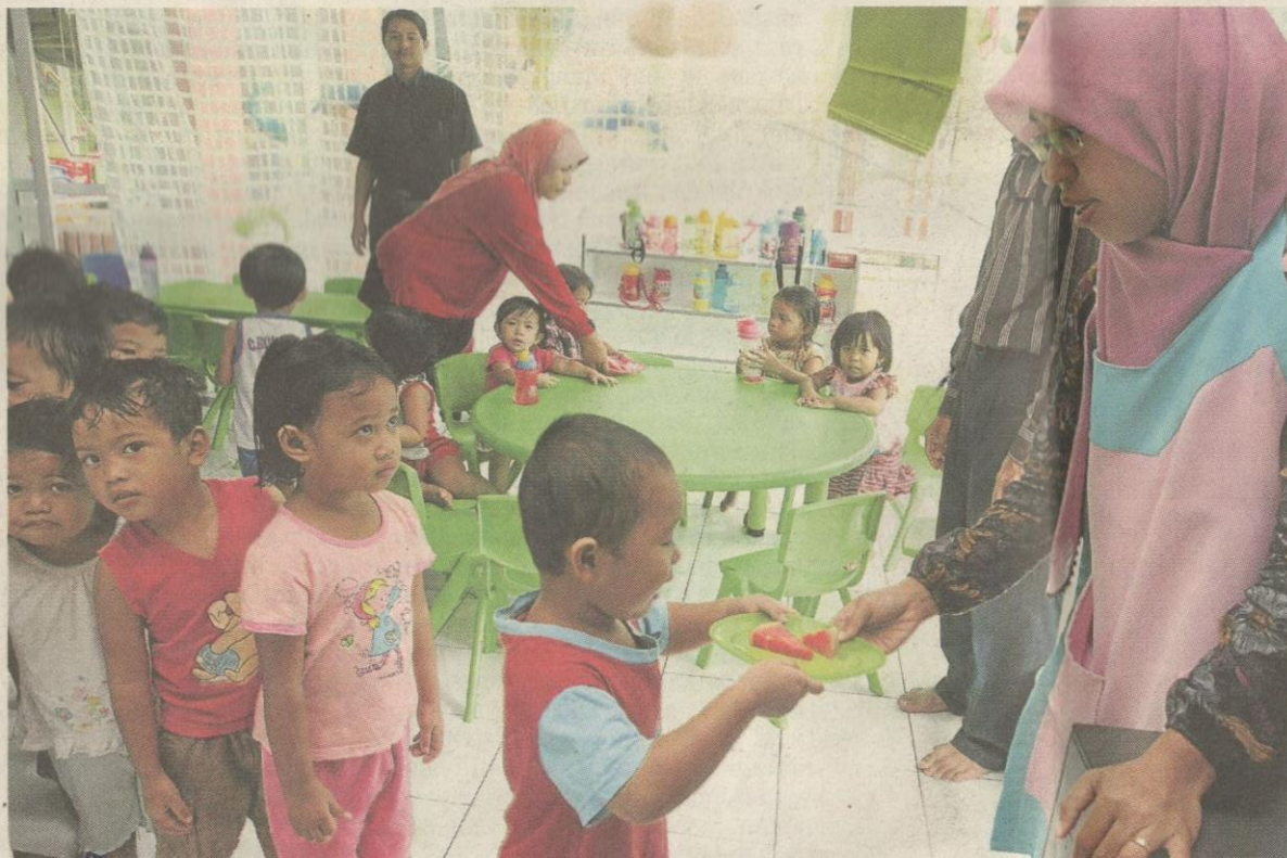
KANAK-KANAK dilatih beratur untuk menerima makanan.

Selain Pusat Asuhan Permata Negara, ramai mungkin tidak tahu bahawa PERMATA turut mempunyai beberapa program lain seperti Per-