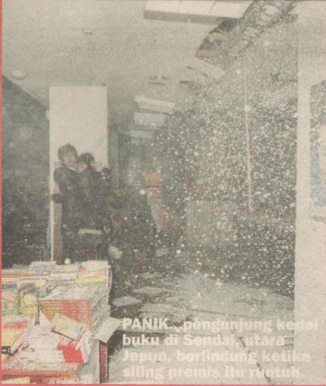
PANIK...pengunjung kedai buku di Sendai, utara Jepun, berlindung ketika siling premis itu runtuh.