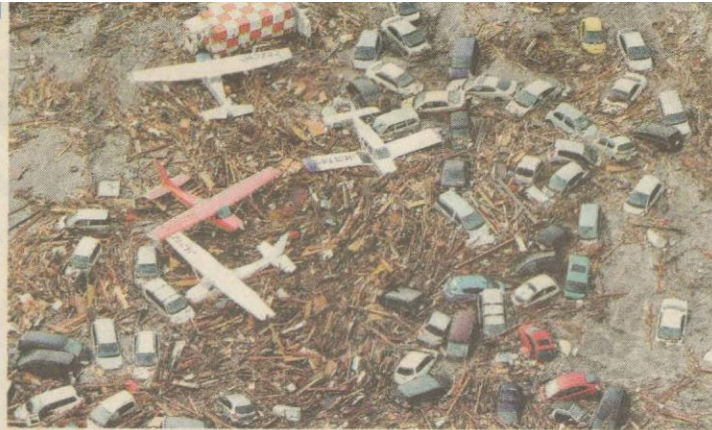
BERSEPAH...beberapa kapal terbang ringan dan kereta tersadai selepas dihanyutkan ombak ke kawasan lapang berhampiran Lapangan Terbang Sendai di utara Jepun.