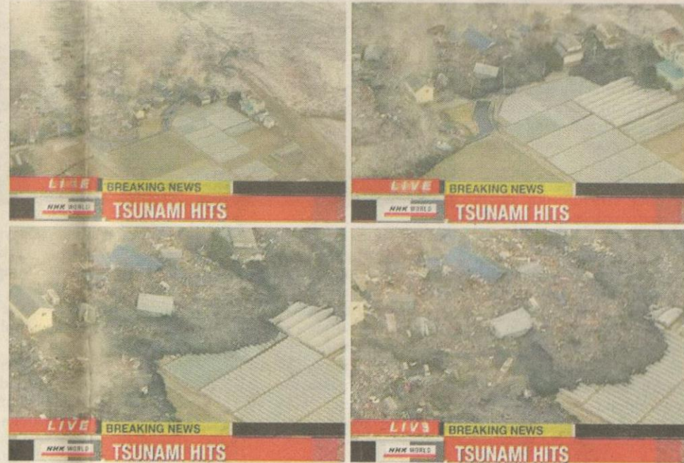
DITERJAH OMBAK...gabungan gambar menunjukkan limpahan air memusnahkan binaan di bandar raya Sendai selepas gempa melanda, semalam.

Palang Merah di Geneva berkata, ombak tsunami itu lebih tinggi daripada sesetengah kepulauan di Lautan Pasifik. - Reuters