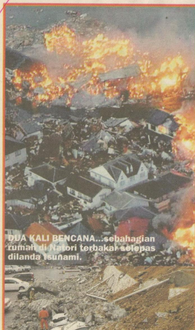
DUA KALI BENCANA...sebahagian rumah di Natori terbakar selepas dilanda tsunami.