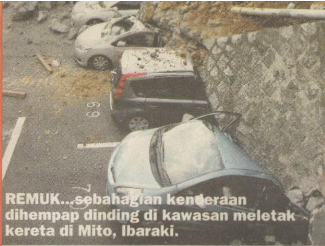
REMUK...sebahagian kenderaan dihempap dinding di kawasan meletak kereta di Mito, Ibaraki.