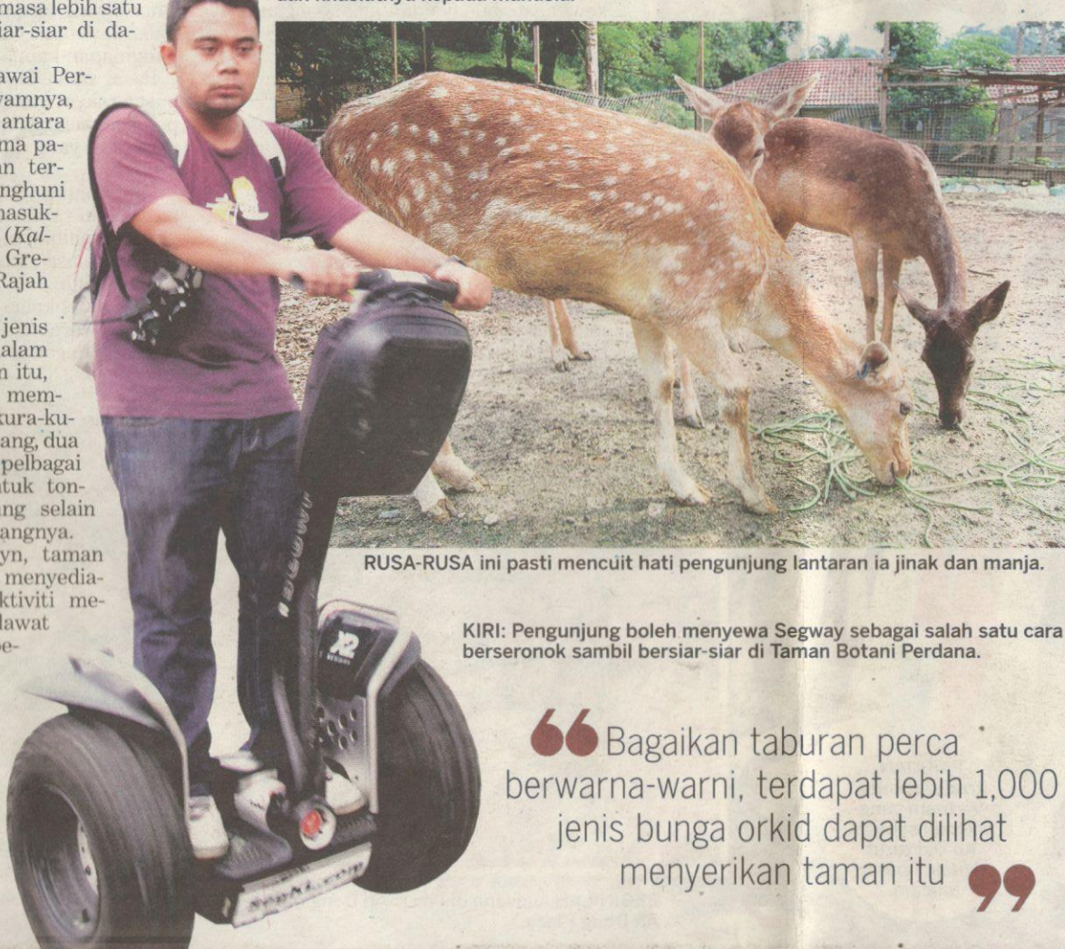
RUSA-RUSA ini pasti mencuit hati pengunjung lantaran ia jinak dan manja.

KIRI: Pengunjung boleh menyewa Segway sebagai salah satu cara berseronok sambil bersiar-siar di Taman Botani Perdana.