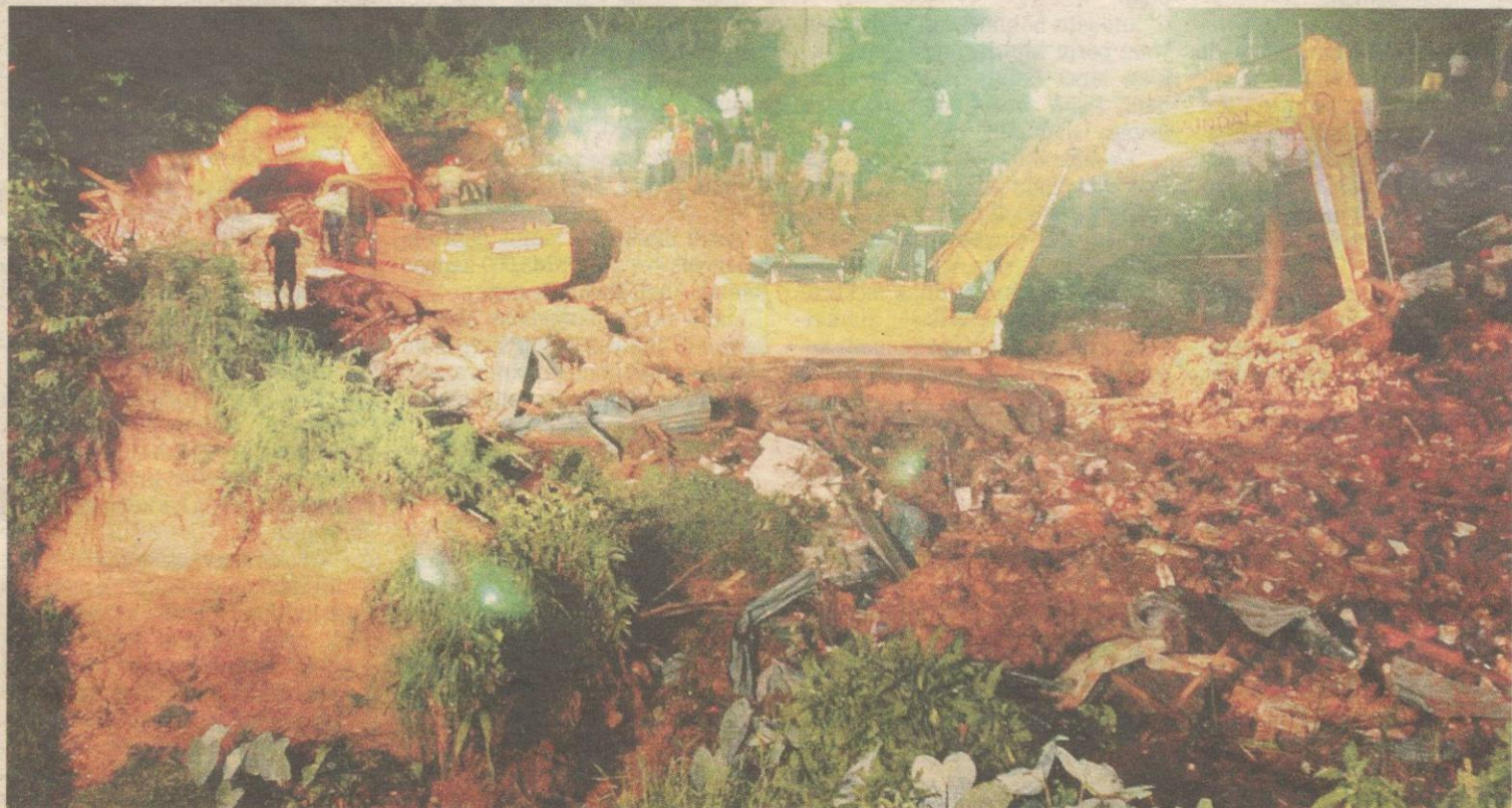
PASUKAN penyelamat menggunakan jengkaut untuk mencari mangsa yang terperangkap dalam kejadian tanah runtuh di Kampung Orang Asli Sungai Ruil dekat Tanah Rata, Cameron Highlands, malam tadi.